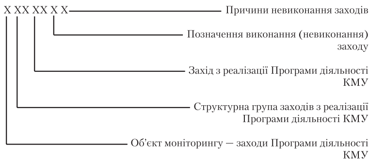
Схема.4.2. Структура кодового позначення економічних заходів правового та організаційного забезпечення реалізації Програми діяльності Кабінету Міністрів України (заходи виконавського типу)

Моделі фреймового типу можуть бути використані у моніторингу регуляторних актів. Саме застосування цього модельного інструмен-