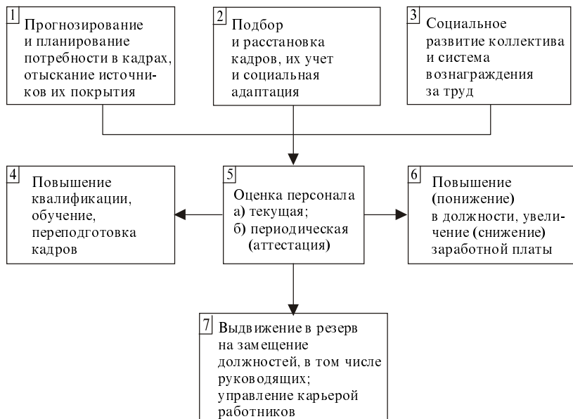
Рис. 2. Структурная схема задач, стоящих перед кадровыми службами предприятий на этапе перехода к рыночной экономике

способствовать усилению отдачи и одновременно развитию потенциала "человеческого капитала" на предприятиях. Структурная схема задач, стоящих перед кадровыми службами предприятий, представлена на рис. 2.