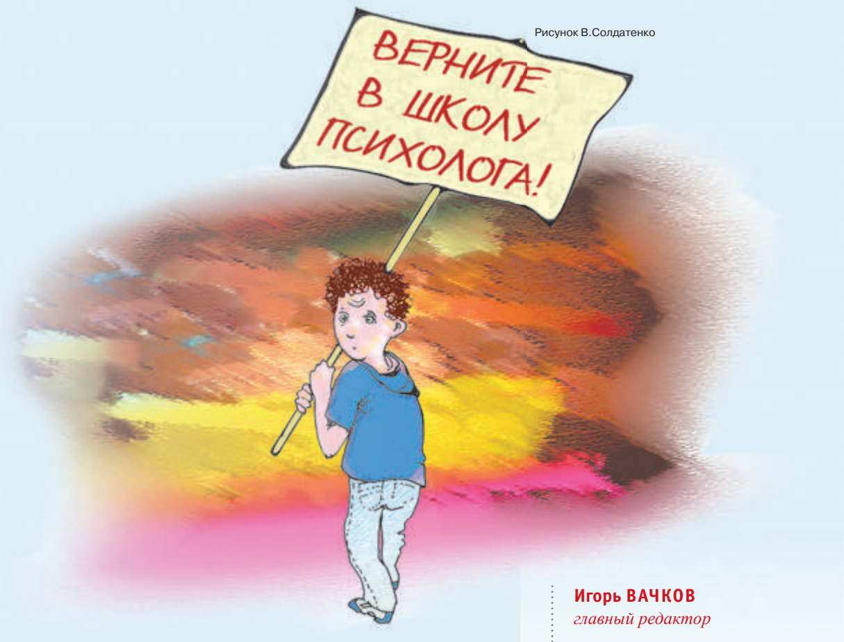
Игорь ВАЧКОВ главный редактор

С удьба испытывает школьную психологическую службу на прочность. Очень хочется быть оптимистом и заявить, что проходили мы и не через такое, что выдюжим и сегодня, справимся с очередными проблемами, что все равно уцелеет психологическая служба, никуда не денется... Хочется, но уверенности такой у меня нет. Недаром говорят: пессимист – это хорошо информированный оптимист.