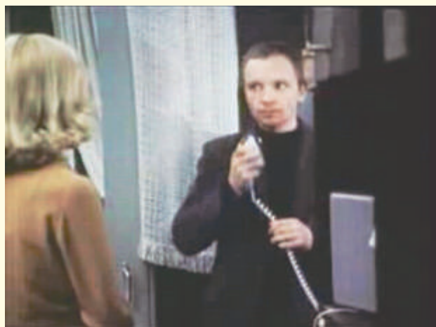
Кадр из к/ф «Ирония судьбы, или С легким паром»

Затем ведущий предлагает рассмотреть ситуацию. Вы идете в школу в новой красивой одежде. Проезжающий мимо автомобиль обрызгивает вас грязью. Ваша реакция? В процессе обсуждения ведущий обращает внимание на различия в ответах (отряхнуться и пойду дальше, вернусь и переоденусь, не буду обращать внимание). Это показывает не только разные тактики поведения, но и различное отношение к произошедшему. Иными словами, сила переживания зависит от того, что человек увидит в неприятном событии: приближающийся конец света или мелкую неприятность?