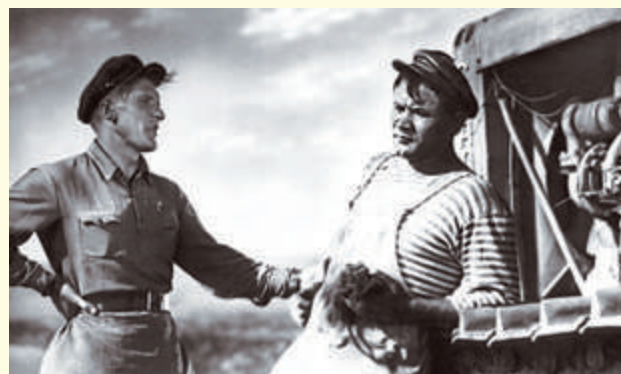
Кадр из к/ф «Трактористы»

После завершения работы в группах участники возвращаются в общий круг и рассказывают о результатах своей работы. Ведущий еще раз зачитывает раздел «Что следует делать». Он обращает внимание на то, что многие рекомендации независимо от ситуации совпадают, например, «сохранять спокойствие», «не спешить», «все обдумать».