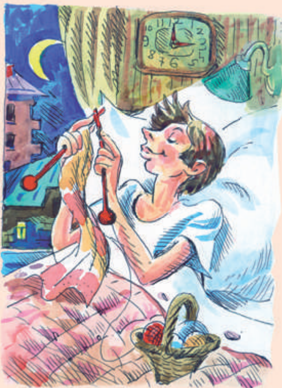
Рисунки Е. Медведева

— Так это же не мне надо так ложиться, — ухмыльнулся Кот, не отрываясь от вязания. ●