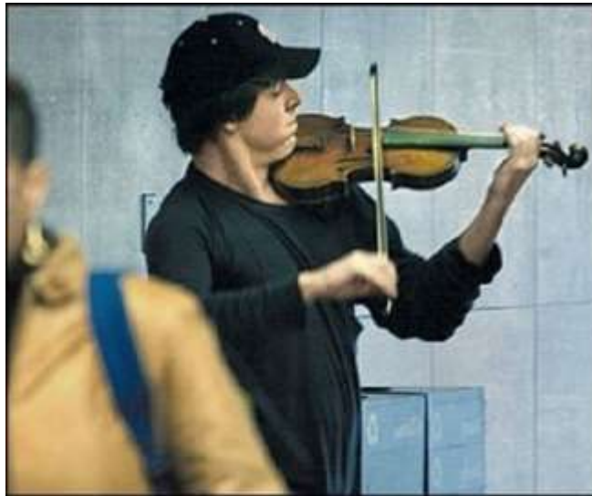
Рис. 1.4. Відомий скрипаль Джошуа Белл під час соціального експерименту газети «Вашингтон Пост»

За два дні перед виступом у метро на його концерті в Бостоні, де середня вартість квитка дорівнювала 100 доларів, був анилаг.