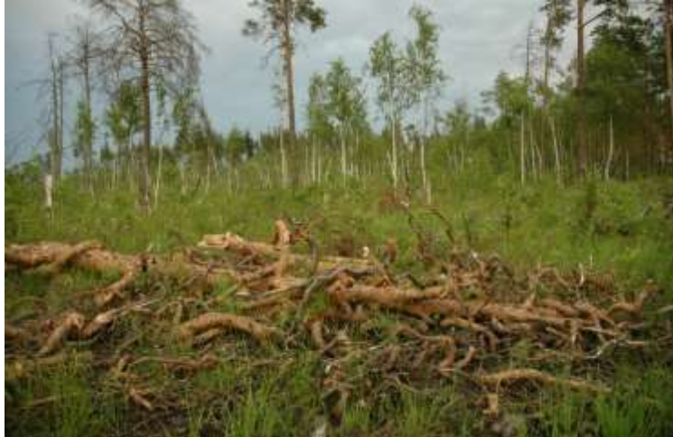
Рис. 1.6. Болота Рівненщини – унікальні об’єкти пізнавального й активного туризму

прикладу, болота Рівненщини – це естетично привабливі об’єкти пізнавального й активного туризму (рис. 1.6), а окремі їх масиви завдяки унікальності біорізноманіття включено до складу заповідних територій.