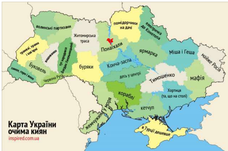
Рис. 1.5. Карта України очима киян 46

Таблиця 1.3 демонструє таку тезу: що більш віддалене місце проживання респондентів від території нашого дослідження, то більше вони схильні об'єднувати на своїй ментальній карті Рівненську та Волинську області в територіально цілісний об'єкт, який за конфігурацією наближений до історичної Великої Волині. Більшість стереотипів має відносно нейтральне забарвлення.