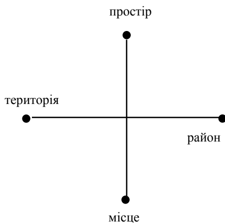
Рис. 1.1. Логіка розуміння простору у традиційній географії (за Г. Д. Костинським)

У більшості визначень увагу сконцентровано на поняттях «простору» і «місця». Отже, географія – наука просторова. Просторовий підхід «червоною ниткою» пронизує всю історію географії. Проте саме тлумачення поняття географічного простору значно трансформувалося: від «порожнього» у Е. Канта до сучасного «багатомірного». У термінології існують поняття «простір», «місце», «район», «територія», зміст і сферу вживання яких часто