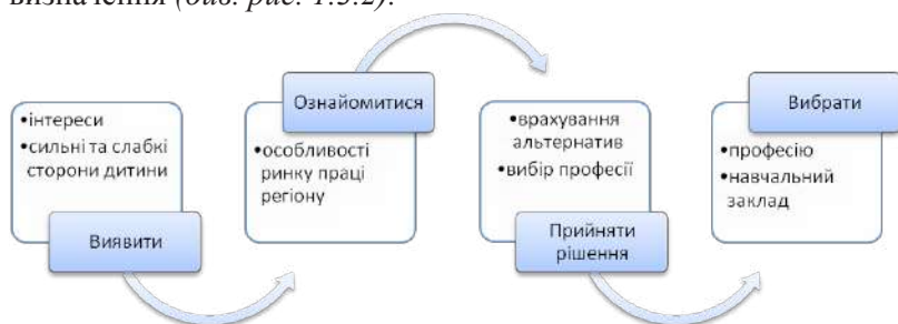
Рис. 1.3.2. Профорієнтаційна робота в школі

Враховуючи те, що загальна мета профорієнтаційної роботи полягає у формуванні готовності до усвідомленого та самостійного професійного самовизначення на основі узгодженості особистих і суспільних інтересів у підготовці кадрів для виробництва, науки, культури (тобто досягнення певного оптимуму професійного самовизначення й потреби суспільства у кадрах), важливою є співпраця навчального закладу та сім'ї з використанням усіх елементів професійної орієнтації. Важливо допомогти учню спільно з батьками пройти етапи від самопізнання до самовизначення (див. рис. 1.3.2).