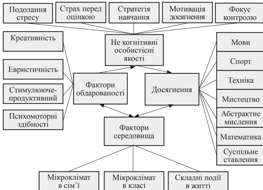
Рис. 1.2.1. Схема взаємозв'язку факторів обдарованості та соціального середовища

звернути серйозну увагу на сім'ю, зробити її союзником у розвитку дитини.