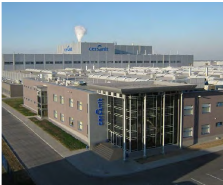
Фото 1. Завод «Церсаніт» у місті Новоград-Волинський, Україна.

На відміну від злиття та поглинання, інвестиції «Грінфілд» створюють нові виробничі потужності, нові робочі місця та сприяють розвитку експорту з країни, виступаючи, таким чином, потужною додатковою рушійною силою розвитку економіки.