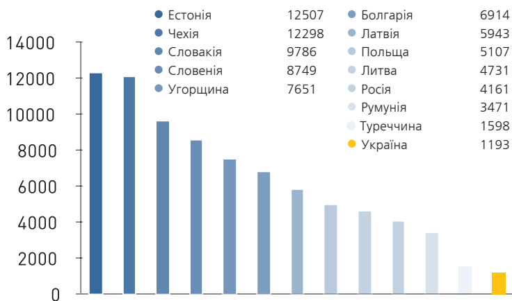
Графік 2. Обсяги ПІІ на душу населення у країнах-сусідах України, дол. США

Обсяг ПІІ, вкладених з початку інвестування в економіку України (1991 рік), станом на 1 січня 2013 року складав 54,4 млрд. дол. США і у розрахунку на душу населення дорівнює 1193 дол. США. Але, якщо порівняти показники залучених інвестицій в розрахунку на душу населення із сусідніми країнами, то стає зрозумілим, що результати України є не більш ніж посередніми.