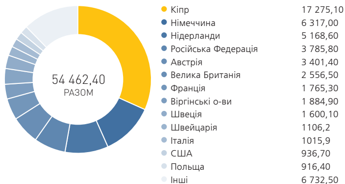
Графік 3. Розподіл ПІІ в Україні за країнами походження, млн. дол. США