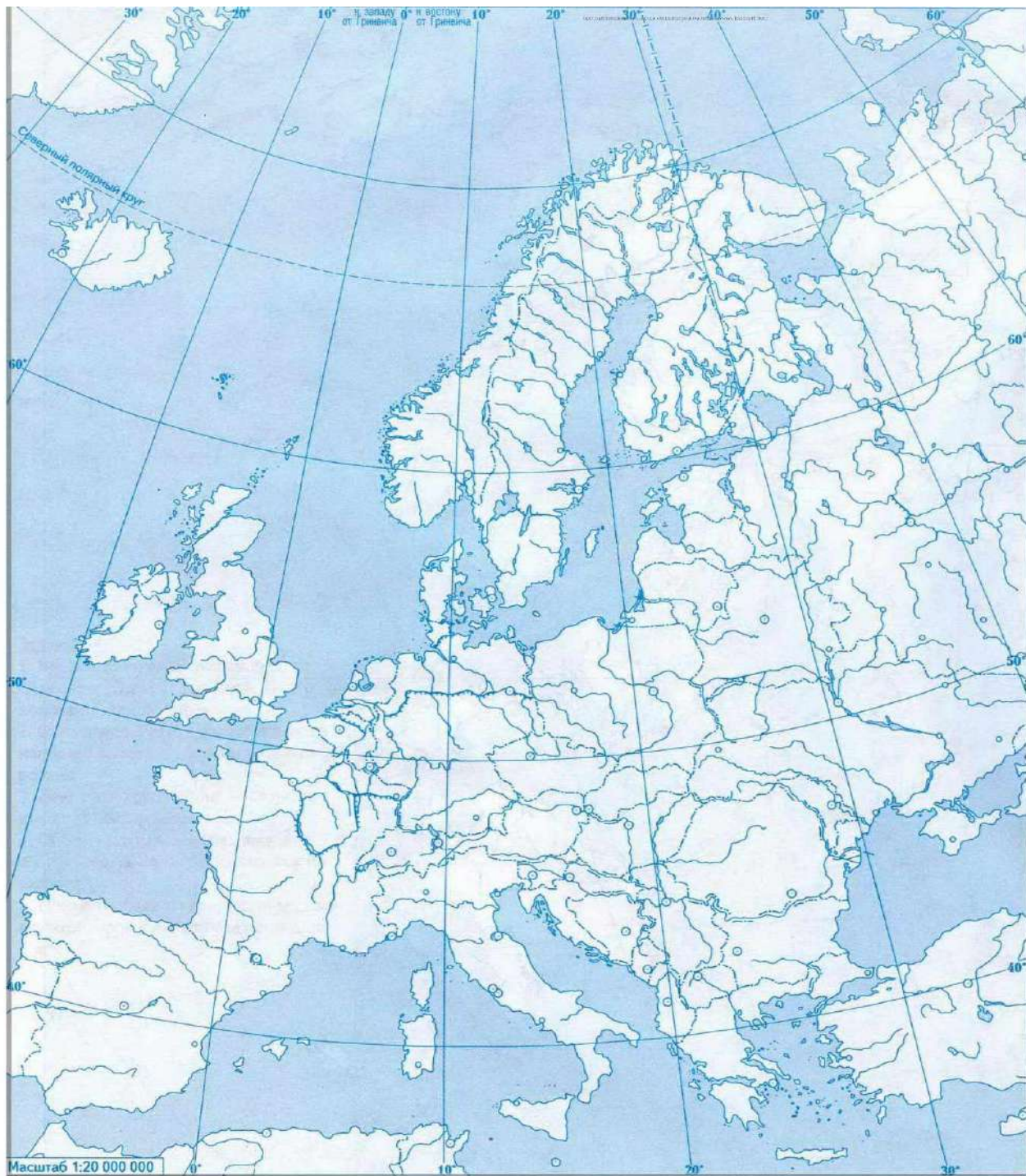
Контурна карта Європи