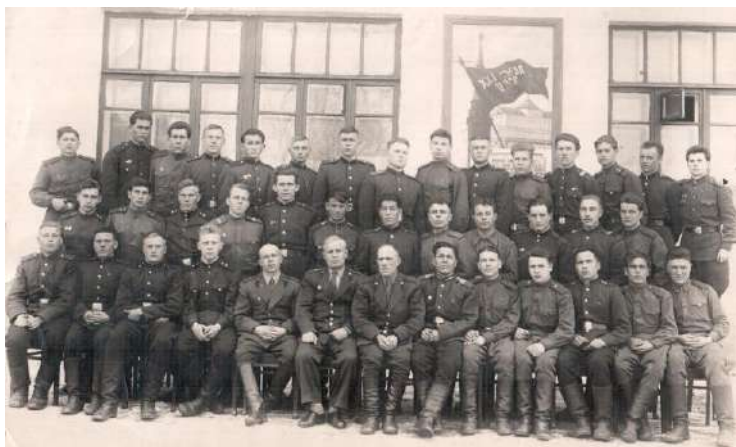
Алма-Атинская спортивная рота, 1961 год