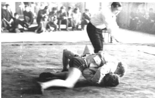
Всесоюзные соревнования по борьбе «самбо» на Приз Космонавтов, приём «удержание 20 секунд».