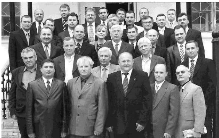
Ветераны УБОП Полтавской области

До октября 2012 года я работал исполнительным директором этого клуба. Благодарю судьбу, что во всех складывающихся обстоятельствах я старался работать по законам чести и совести. И только это является верным спутником успеха в оперативной работе и любого сотрудника.