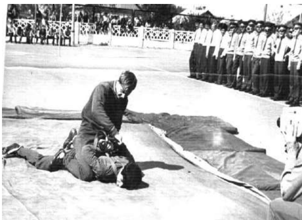
Показательные выступления по боевому «самбо» в Карагандинской ВШ МВД СССР

Совмещал работу горного мастера в шахте «Михайловская», готовился поступить на заочное отделение в Карагандинский политехнический институт, а также работал тренером спортивного и боевого «самбо» в Карагандинской высшей школе МВД СССР. Команда самбистов ВШ МВД СССР боролась на всесоюзных и республиканских соревнованиях, в Волгограде, Томске, Алма-Ате и др.