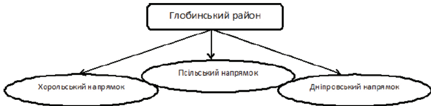
Рис. 1. Перспективні напрями формування екологічних маршрутів

Перлиною ж туристичної галузі для Глобинщини є долина річки Дніпро, а самеузбережжя Кременчуцького водосховища. Це стосується не тільки екологічного, а й інших видів туризму. Піший і велосипедний туризм вздовж Дніпра є чудовим варіантом для туристів, водний туризм тут теж можливий, але не сплав по річці, як на Пслі, а відвідини Дніпровських островів, наприклад в гирлі Псла і Сули. Водний туризм є досить небезпечним, особливо для тієї вікової групи учнів, що займається в гуртку. Дніпровський напрямок є перспективним в національному масштабі, адже масштабні географічні об’єкти постійно перетинаються з історико-культурними і створюють неповторний колорит Глобинщини. Окрасою цього напрямку звичайно є Нижньосульський національний природний парк, створений в гирлі річки Сула, а також десятки островів, розташованих в кількох кілометрах від берега. Не менш значущою і відомою пам’яткою природи є гора Пивиха, що височіє на Дніпром.