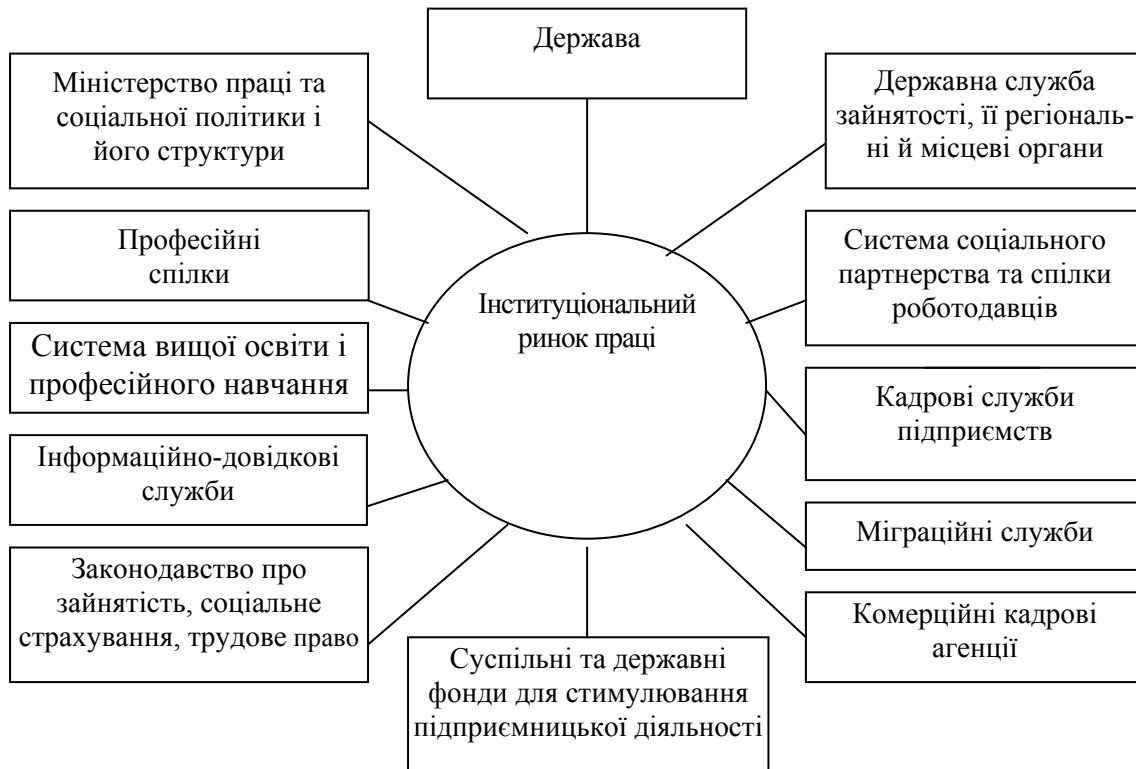
Рис. 1. Інститути ринку праці та його інфраструктура

зміст інфраструктури ринку праці повніше розкриватиметься у пропонованих для неї функціях: інформаційна, регулююча, стимулююча, розподільна, прогностична, міжнародна. Інституціональне забезпечення розвитку інфраструктури ринку праці є найважливішою умовою позитивної трансформації та розвитку економічної системи. В Україні інфраструктура ринку праці та її інститути продовжують формуватися й удосконалюватися. В останні роки в Україні багато зроблено в інституціональному облаштуванні ринку праці.