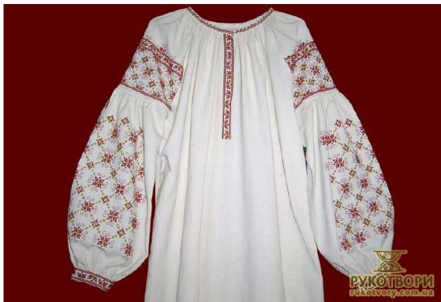
Рис. Д. 4 Сорочка. Юлія Василичена. Київ.