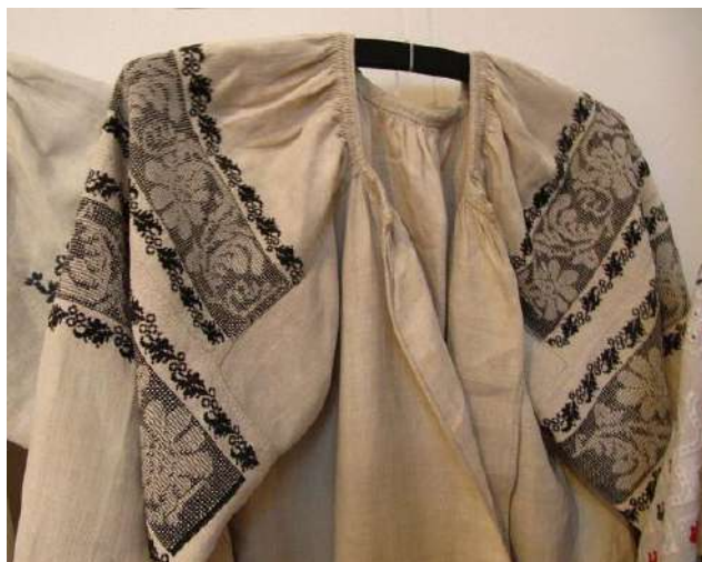
Рис. А. 5 Традиційна вишита сорочка. Сумщина.