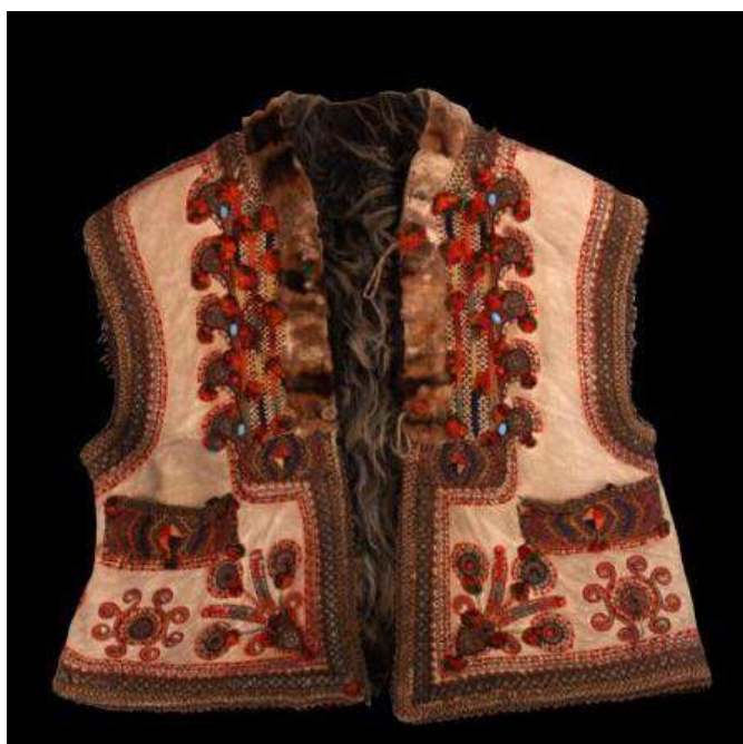
Рис. А. 11 Кептар жіночий. Овече хутро, хутро лапок лисиць; вишиття, аплікація. Рахівський р-н, Закарпатська обл. Поч. XX ст.