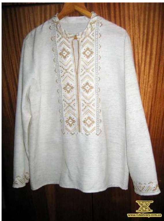
Рис. Д. 7 Сорочка чоловіча. Юлія Гончарова. Рівненщина.