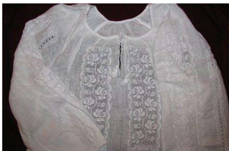
Рис. Д. 11 Сорочка жіноча. Надія Вакуленко. Решетилівка.