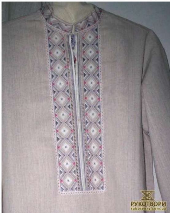
Рис. Д. 2 Чоловіча сорочка Марина Василенко. Житомирщина.