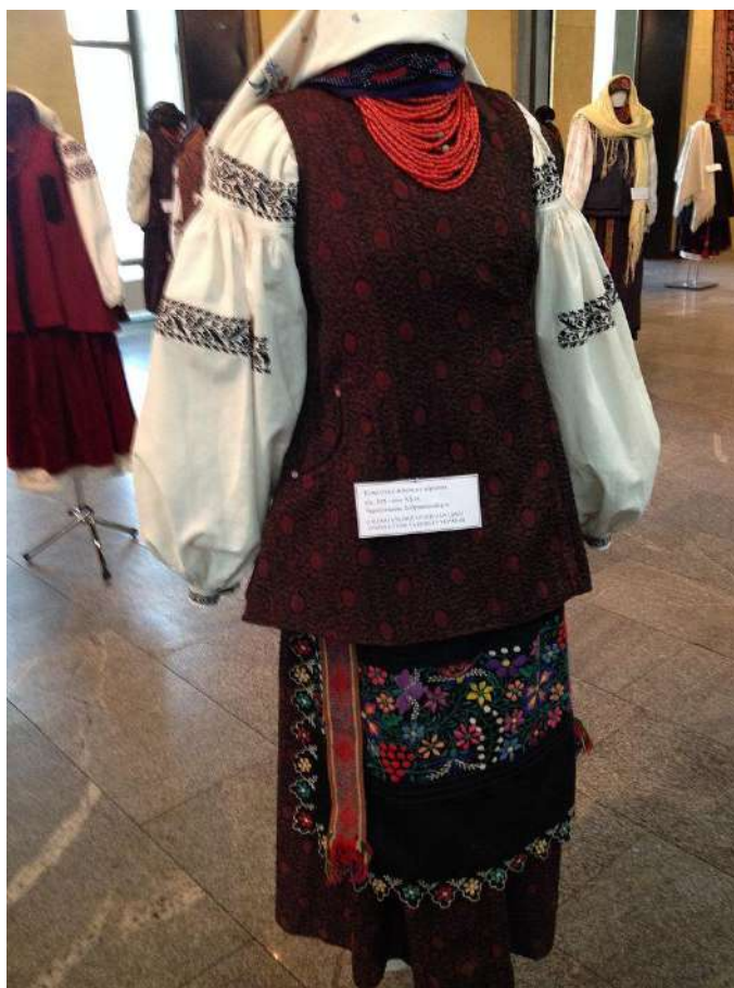
Рис. А. 13 Вишивка на Чернігівському строї (Бобровицький р-н).