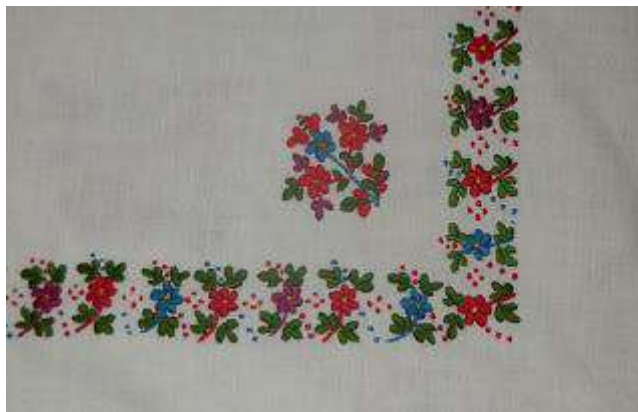
Рис. А. 8 Вишита яворівська хустина (с. Залужжя).