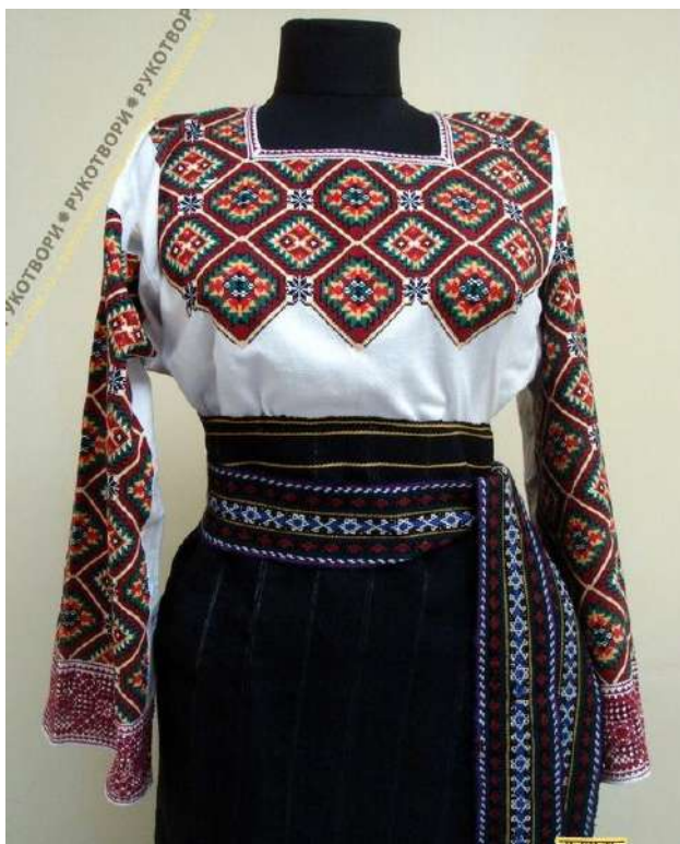
Рис. Д. 8 Жіночий стрій. Діана Новак. Чернівці.