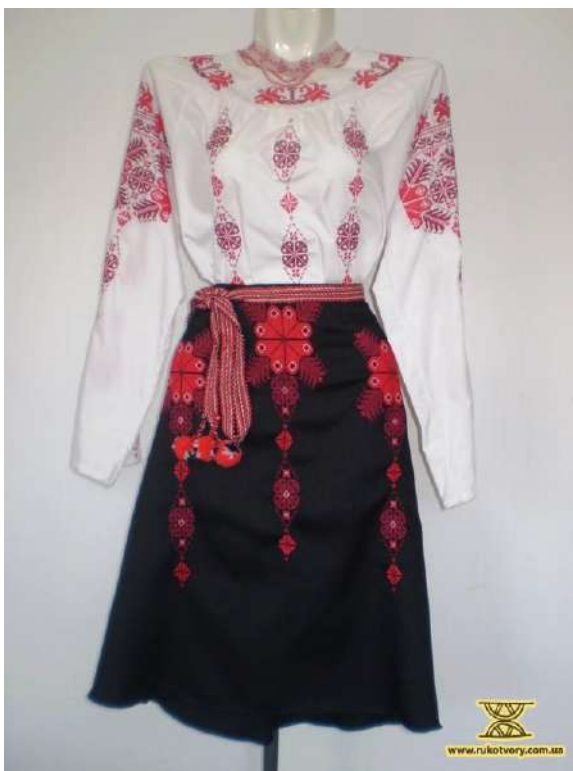
Рис. Д. 6 Жіночий стрій. Марія Романюк. Івано-Франківщина.