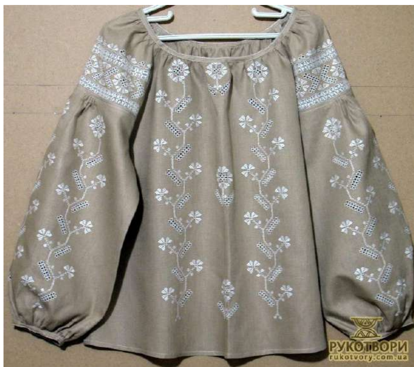
Рис. Д. 5 Сорочка. Лариса Пелюгіна. Решетилівка.