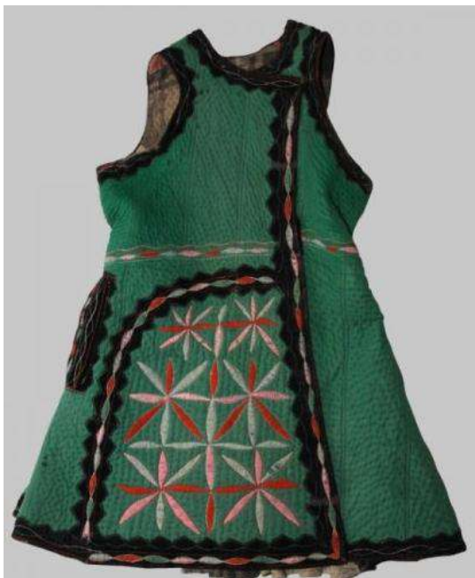
Рис. А. 10 Корсетка. Вовна, плис, домоткане полотно; вишиття. Київська обл., Бородянський р-н.