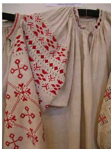
Рис. А. 2 Традиційна вишита сорочка. Волинь.