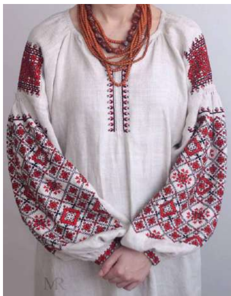
Рис. А. 4 Традиційна вишита сорочка. Кіровоградщина.