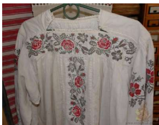
Рис. А. 3 Традиційна вишита сорочка. Житомирщина.