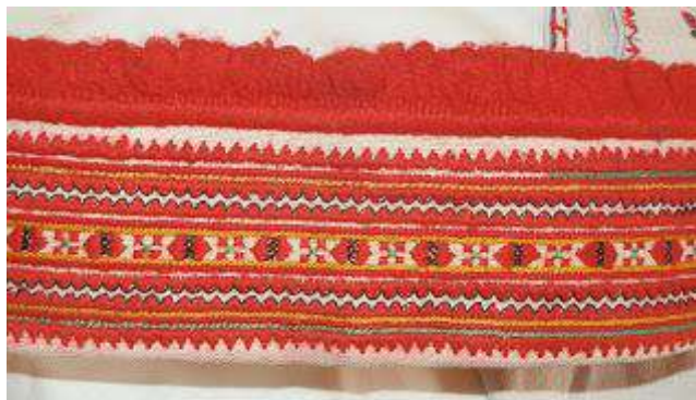
Рис. А. 9 Яворівська вишита бавниця (с. Залужжя). Бавничкові шви.