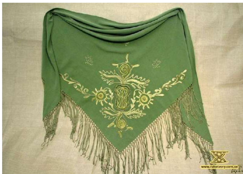
Рис. Д. 9 Хустка. Тетяна Дубовець. Черкащина.