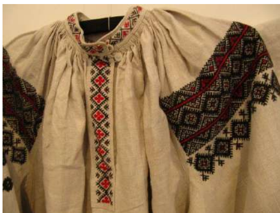
Рис. А. 1 Традиційна вишита сорочка. Вінничина.