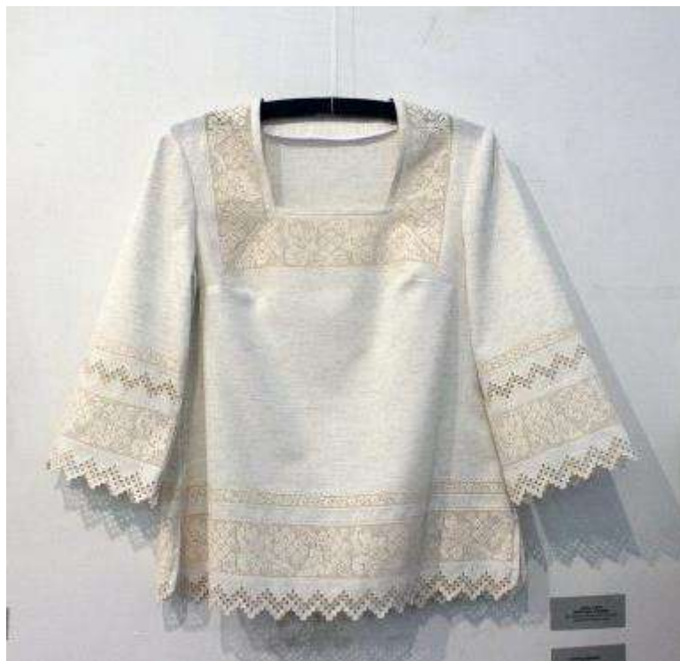
Рис. Д. 10 Сорочка жіноча. Ніна Іпатій. Решетилівка.