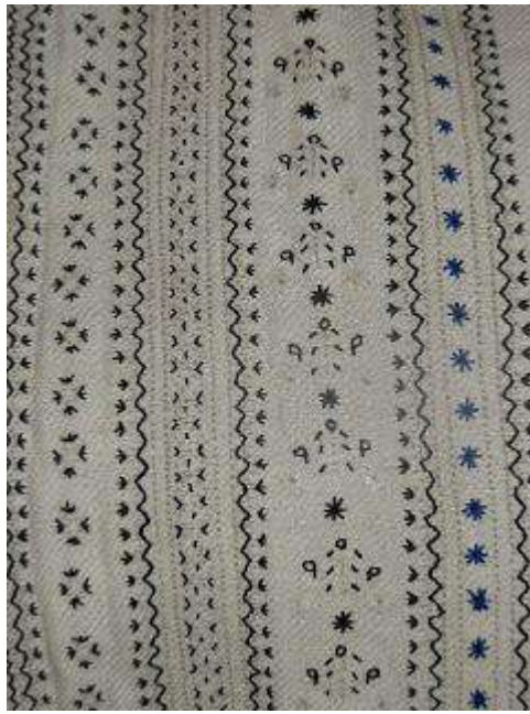
Рис. А. 7 Вишивка на кабаті. Фрагмент (сmt. Шкло). Яворів.