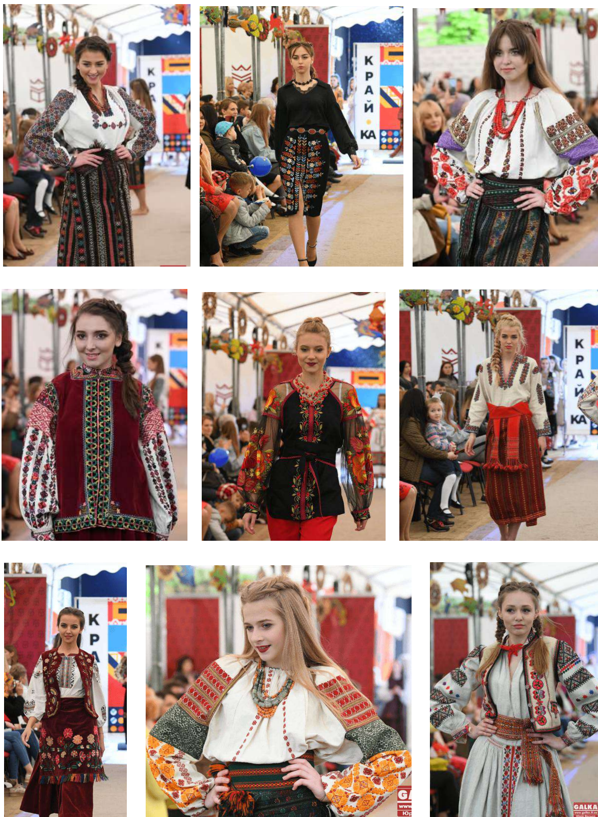
Рис. В. 1-9. Етнопоказ на фестивалі «КРАЙ-КА» в Івано-Франківську, 2019.