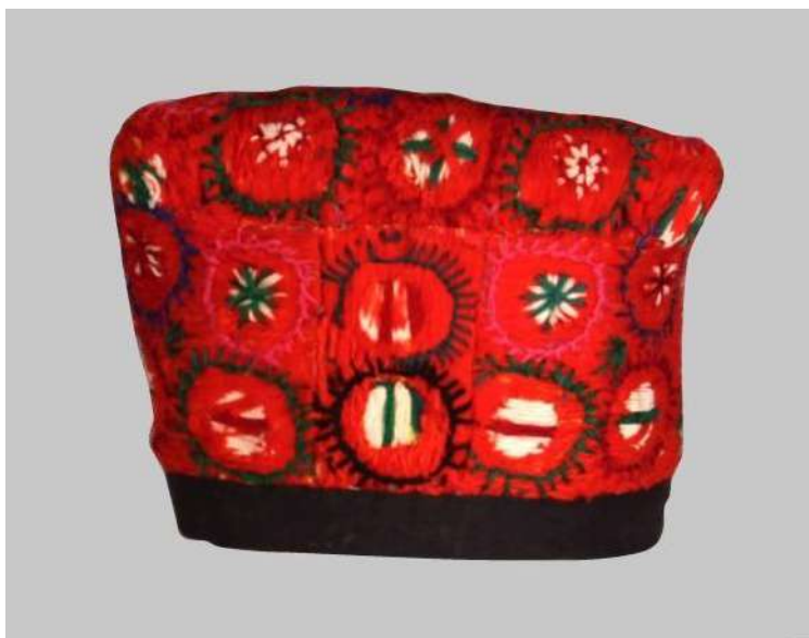
Рис. А. 12 Очіпок суцільно вишитий. Ситець, сатин, гарус, домоткане полотно; ручне пошиття, гладь. с.Наливайківка, Макарівський р-н, Київська обл. XIX ст.