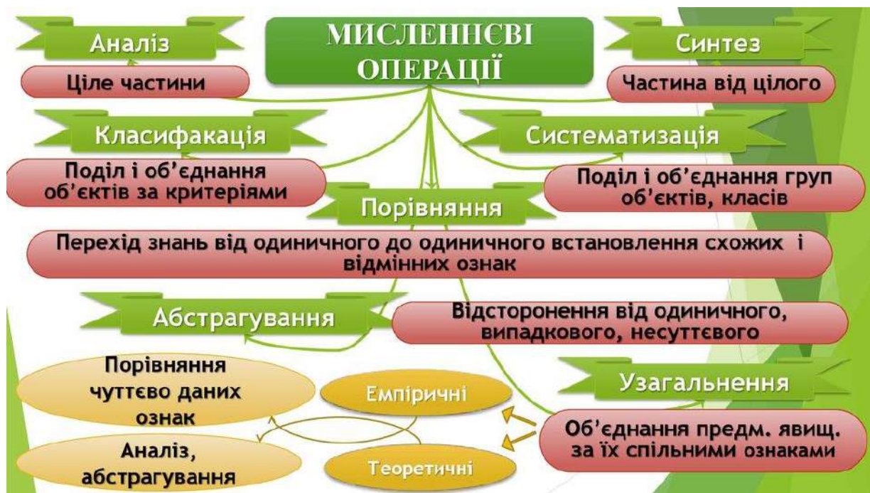
Рис.1. Структура мисленнєвої операції

Формуванню елементів мислення та навичок мисленнєвої діяльності при розв'язуванні задач допомагають вправи творчого характеру: розв'язування задач підвищеної складності, розв'язування завдань кількома способами, розв'язування задач з відсутніми чи зайвими даними, розв'язування задач, що мають кілька розв'язків, а також вправи на складання і перетворення задач.