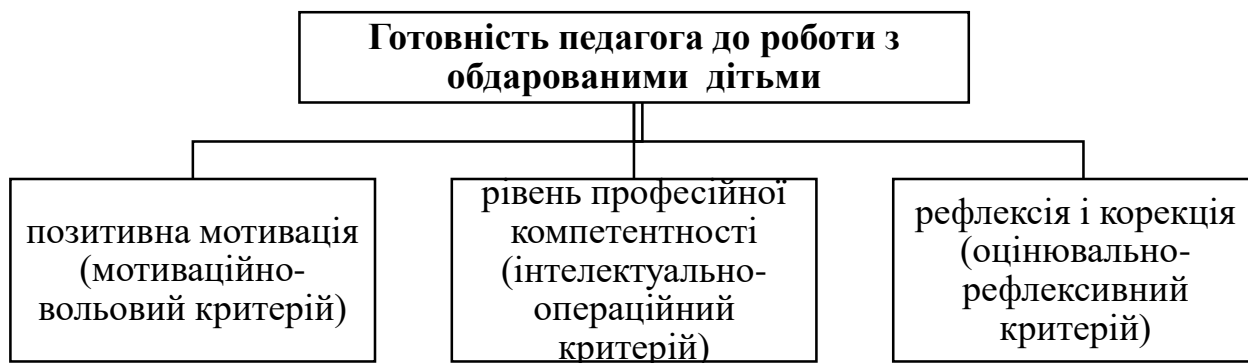
Рис. 1. Готовність педагога до роботи з обдарованими дітьми

Результатом підготовки студентів до професійної діяльності в цілому, розвитку обдарованості зокрема є стан готовності. Зустрічаємо в науковій літературі [4], що готовність педагога до роботи з обдарованими дітьми виявляється у високому рівні професійно-педагогічної компетентності спеціаліста до даного виду діяльності, що базується на сукупності спеціальних знань і вмінь та стійкому вмотивованому бажанні здійснювати цю діяльність. Науковці виокремлюють такі компоненти готовності вчителя до роботи з обдарованими учнями: позитивна мотивація; достатній рівень професійно-педагогічної компетентності; рефлексія і корекція (рис. 1).