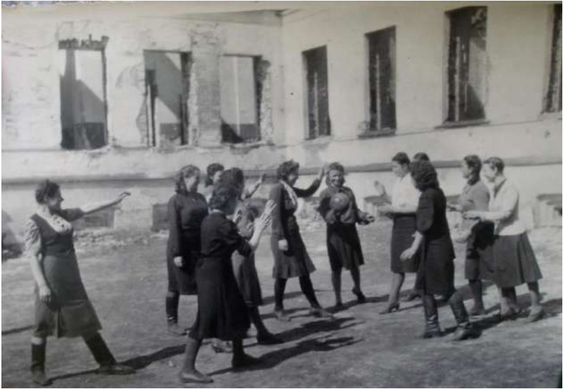
Студентки повоєнних років у дворі напівзруйнованої будівлі по вул. Сковороди, 14.