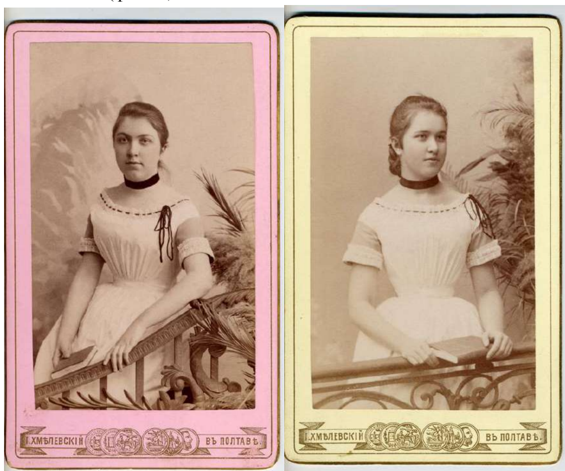
Фото 4. Вихованки Полтавського інституту шляхетних дівчат 1892 р.

Зібрати дитину на навчання батькам в XIX столітті були недешево, часто до зборів недостатньо забезпечених дітей доводилося підключатися міським благодійникам. Гімназичну форму за встановленим зразком шили на замовлення. Форму училищ можна було купити готовою, що було дещо дешевше (фото 4).