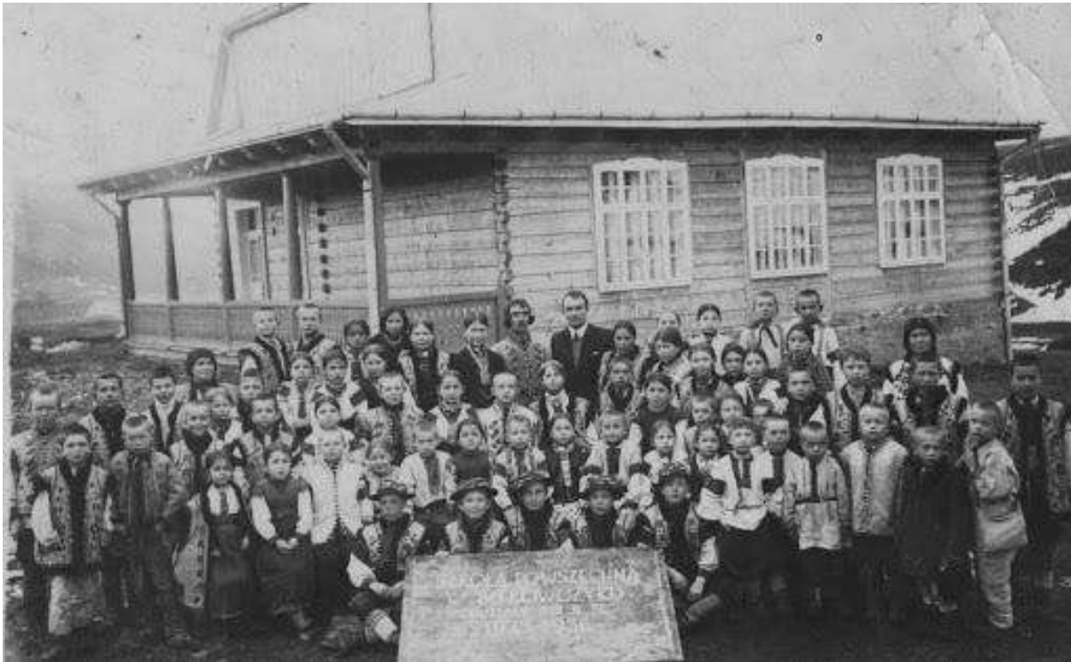
Фото 1. Учні Битківчанської початкової школи (1935-1936 рр.)

пишно вишитими рукавами, червоними, синіми, рідше чорними та зеленими, нитками з геометризованим щільним орнаментом. Поверх сорочки обгорталася темно-руда горботка з вовняної тканини, яка фіксувалася на талії широкою крайкою зі щільним геометричним малюнком вишивки червоними нитками. По крайці пов'язували один або два вузьких вовняних пояски (баюрки). Поверх сорочки одягали цурканку або мунтян – кожушок-безрукавка, розширений до низу з ворсовим покривом на виворітню сторону. Обшивають мунтян по проймах рукавів та передньому розрізі хутром тхора або куниці, по низу – баранячим смушком. По периметру мунтян прикрашений «силянкою», а перед оздоблений заокругленими зубцями із зеленого та коричневого сап'яну. По низу розміщуються сап'янові стилізовані квіти і листочки. В зимовий період носили довгі кожухи, оздоблені аплікацією з шовку (фото 1).