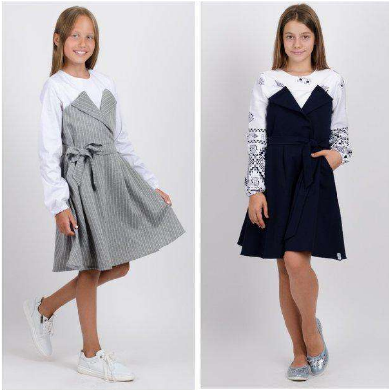
Фото 7. Шкільний одяг з колекції Андре Тана

Еволюція шкільного одягу в Україні пройшла складний шлях – від запозичення іноземних стилів (у XIX ст. на сході нашої країни) й повного невілювання (на заході у XIX ст.), через етапи строгої регламентації (середина XX ст.) аж до пошуків сучасного власного стилю. Шкільний одяг може бути різним, але залишаються незмінними вимогами до шкільного одягу – це зручність, комфорт та етикет зовнішнього вигляду учнів. Позитивними напрямками вдосконалення шкільного одягу є запровадження шкільного дрес-коду з елементами національної символіки, характерної для певного регіону України. Це дозволить зреалізувати естетичне та національно-патріотичне виховання молоді, формування етикету зовнішності та культури поведінки у суспільстві та з однолітками.