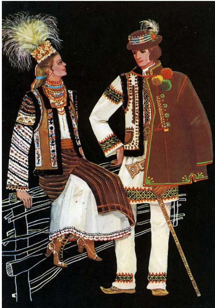
Рис. 2 Буковинський стрій

дъорданик, кода, коробка, капелюшиння, вінок, а також квіти. Оригінальні вінкоподібні або шапкоподібні вироби, основи яких робилися з картону і потім обшивалися тканиною, прикрашалися штучними квітами, тасьмою, бісером, скляними намистинами, монетами, шовкови китичками, павиним пір'ям тощо. Ззаду до основи пришивали різнокольорові стрічки. Окремо до головних уборів прикріплювали пучки стебел ковили, які, розпушуючись на повітрі, надавали виробам досить екзотичного вигляду (рис. 2).