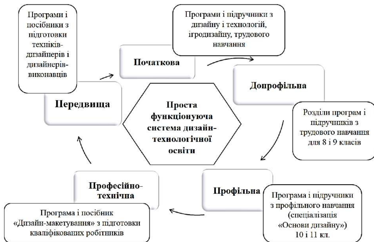
Рис. 2. Проста функціонуюча дизайн-технологічна освіта (авторська модель Ю.В. Дідовця).

Ми переконані, що дизайн-технологічна і дизайн-мистецька «потенційні» системи можуть стати «працюючими» за однієї важливої умови – це підготовка майбутніх фахівців з дизайну і технологій та мистецтва і дизайну у закладах вищої педагогічної освіти та інженерно-педагогічної освіти.