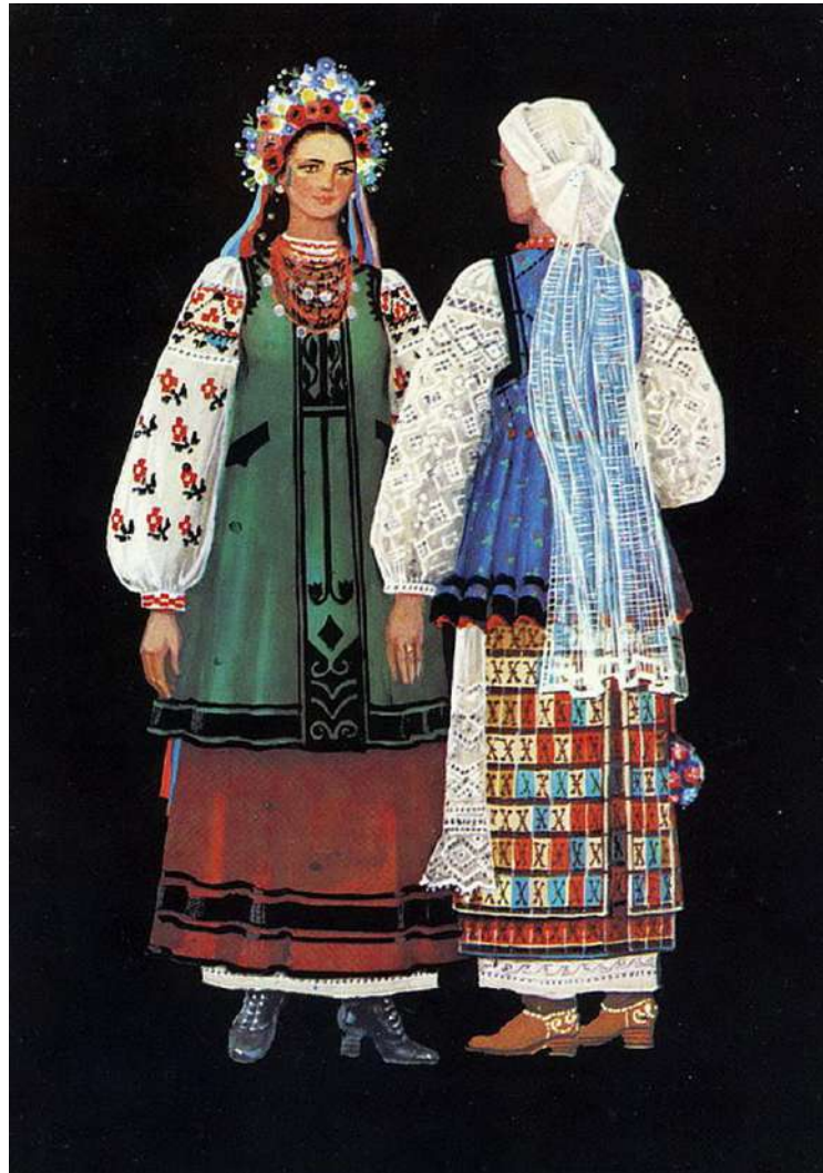
Рисунок 1. Жіночий одяг Полтавщини

Також жінки пов'язували на голову хустину, складену у вигляді тюрбана, носили на голові кораблики, з вилогами з оксамиту та з верхом з шовкової парчі. Крім корабликів носили також високі кибалки, покриті шовковим серпанком з довгими кінцями. Взимку на голові заможніші носили чепці з наміткою, а міщанки круглі шапочки з опушкою з хутра соболя.