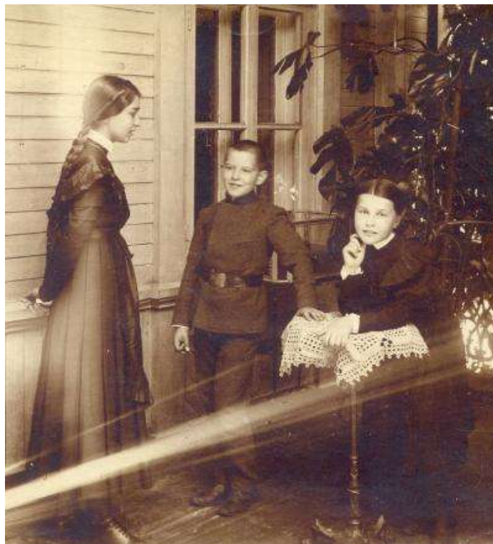
Фото 3. Гімназисти

Кашкети зазвичай були світло-синіми з трьома білими кантами і з чорним козирком, причому особливим шиком серед хлопчаків вважався пом'ятій кашкет з поламаним козирком. Узимку до нього додавалися навушники і капюшон кольору натуральної верблюжої вовни, оздоблений сірою тасьмою. Зазвичай учні носили суконну гімнастерку синього кольору зі срібними опуклими гудзиками, підперезану чорним лакованим ременем зі срібною пряжкою і чорні брюки без канта. Була і вихідна форма: темно-синій або темно-сірий однобортний мундир з обшитим срібним галуном коміром (фото 3). Незмінним атрибутом гімназистів був ранець. За весь час свого існування гімназичні і студентські мундири змінювалися до 1917-го кілька разів (у 1855, 1868, 1896 і 1913 роках) – відповідно до моди. Але весь цей час форма хлопчиків була чимось середнім між цивільним і військовим костюмом.