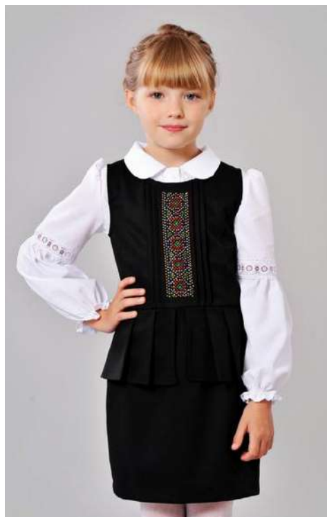
Фото 6. Бренд дитячого одягу ВоGi