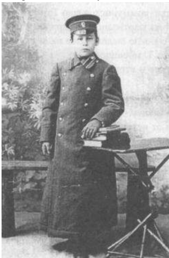
Фото 2. Гімназист

У 1834 році в Російській імперії було прийнято закон, який затвердив загальну систему всіх цивільних мундирів імперії, як гімназійних, так і студентських. Костюми, які носили хлопчики не тільки під час занять, а й після них, були своєрідним поєднанням військового і цивільного чоловічого вбрання. Форма гімназиста відрізняла підлітка від тих дітей, які не навчалися або не могли дозволити собі вчитися. Вона була предметом гордості й водночас певним чином вказувала на стан хлопчика в суспільстві: у гімназіях навчалися лише діти дворян, інтелігенції і багатих промисловців. У всіх навчальних закладах форма була військового фасону: незмінно кашкети, гімнастерки і шинелі, які відрізнялися лише кольором, кантами, гудзиками та емблемами (фото 2).