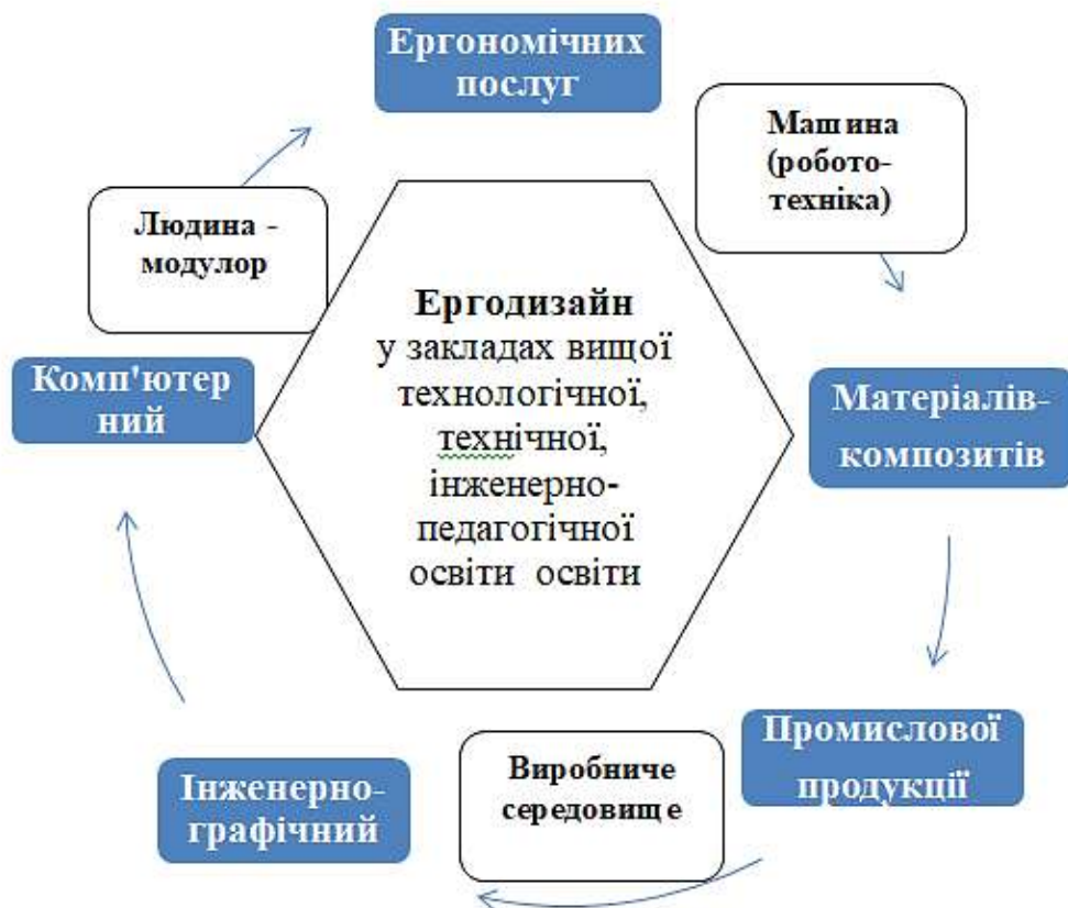
Рис. 4. Ергодизайн як проста функціонуєча виробничо-технологічна система «людина (модуль) – машина (робототехніка) – виробниче середовище»

Всі чотири прості функціонуєчі системи (дизайн-технологічна, дизайн-мистецька, етнодизайну, ергодизайну) – це потенційні підсистеми цілісно структурованої складної системи української національної дизайн-освіти, яка ще науково не обґрунтована і не застосована у педагогічній практиці.