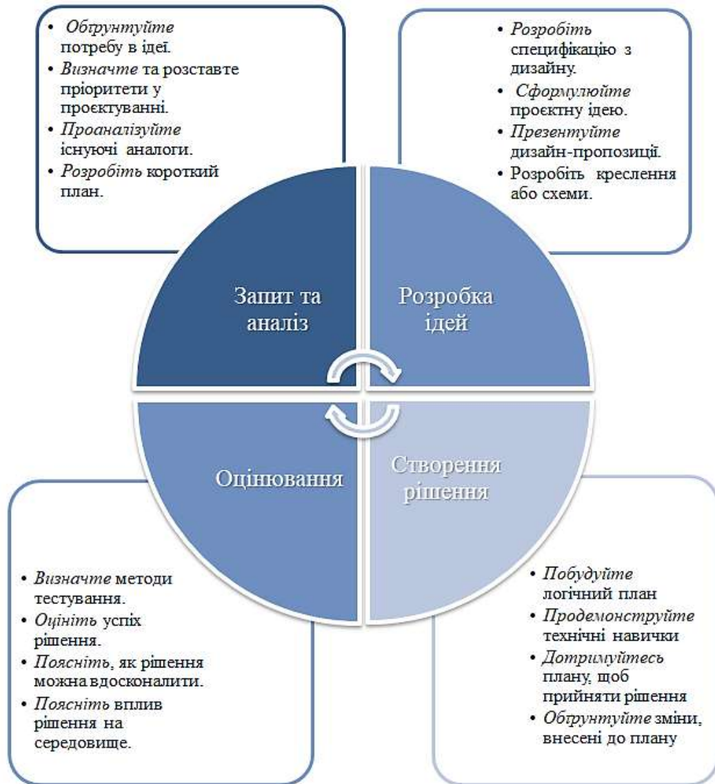
Рис. 1. Технологічний цикл дизайну

рівність і розвиток (fairness and development), глобалізація і сталий розвиток (globalisation and sustainability). Глобальні контексти допомагають учням розпізнати зв'язок між тим, чого вони навчаються в класі, і навколишнім світом, пов'язувати між собою різні предметні галузі, допомогти студентам інтегрувати знання у взаємодоповнювану цілісну картину.