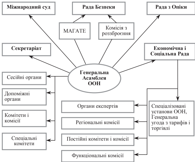
Рис. 2.1. Структурна побудова системи Організації Об'єднаних Націй

4) експертні органи (спеціальна група експертів з міжнародної співпраці з питань оподаткування).