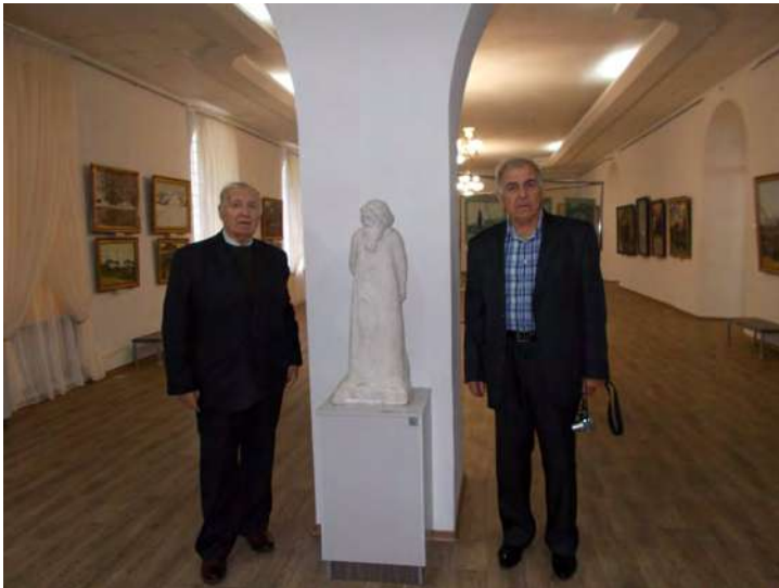
В залах Картинної галереї імені І.Ю.Рєпіна в Чугуєві.