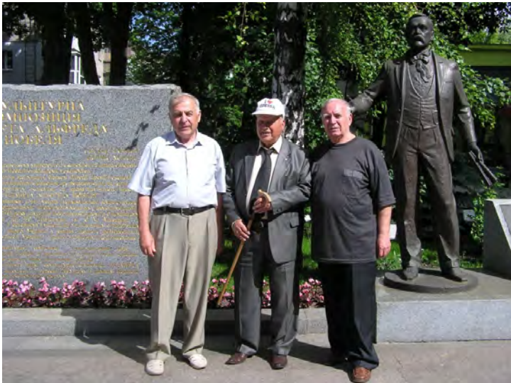
Біля стели і скульптури Альфреда Нобеля на території університету.