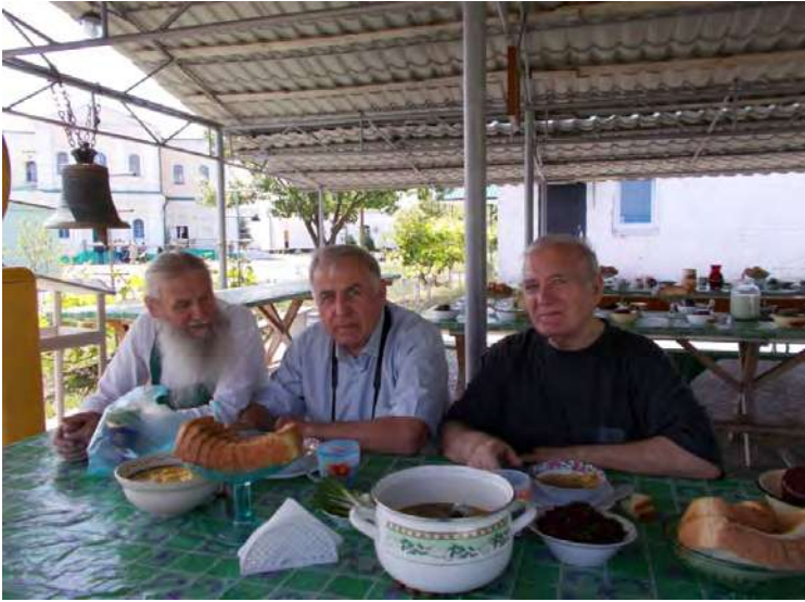
Бесіда з монахом Свято-Миколаївського монастиря Миколаєм у літній трапезній.