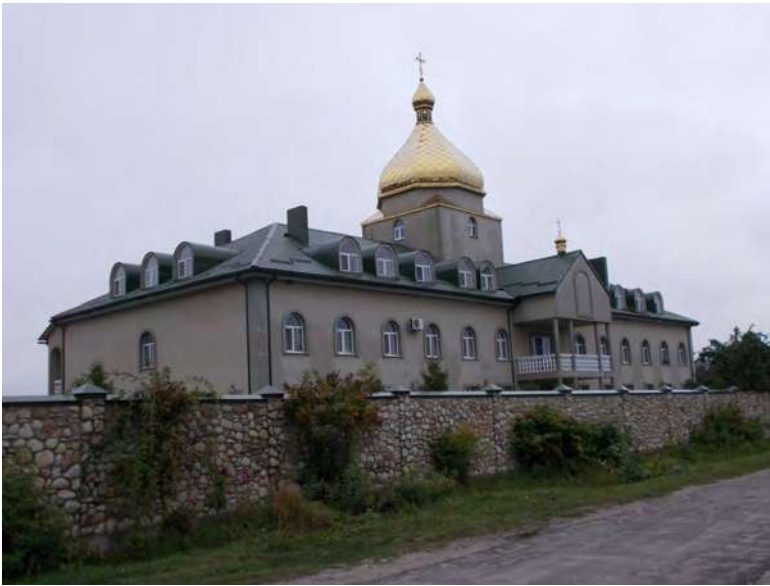
Петропавлівський чоловічий монастир біля церкви села Світязь.