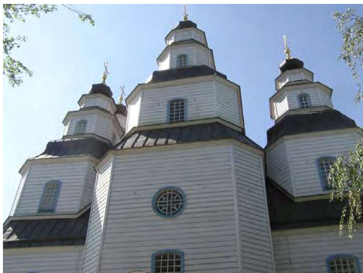
Новомосковський Троїцький собор.