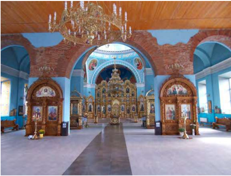
Молитвний зал та іконостас Свято-Покровського Собору в Чугуєві.