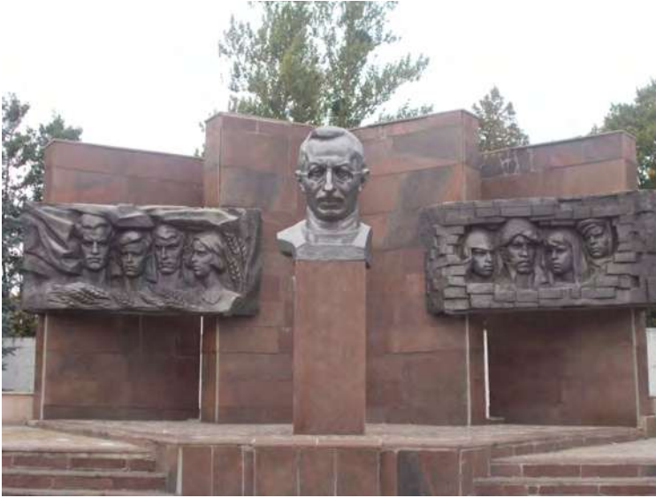
Пам'ятник А.С.Макаренку та його вихованцям на території теперішньої колонії в селі Подвірки на Харківщині.

2.10.Село Ковалівка Полтавського району, Полтавський обласний науковий ліцей-інтернат І-ІІІ ступенів імені А.С. Макаренка, Міжрегіональний науково-практичний семінар «Школа – духовний осередок розвитку особистості, демократичної територіальної громади і країни», виступи В.В.Рибалки, А.П.Самодрина, В.Ф.Моргуна з доповідями і проведення тренінгу освітянського осередку громадянського суспільства