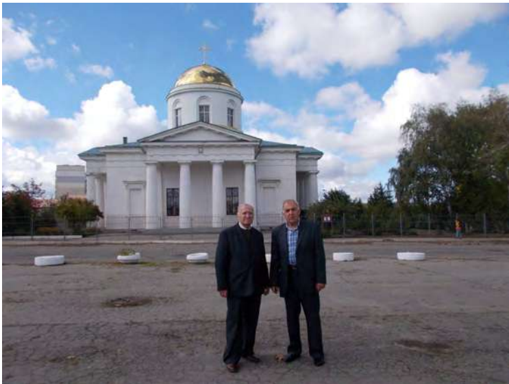
На фоні величного Свято-Покровського собору в Чугуєві.