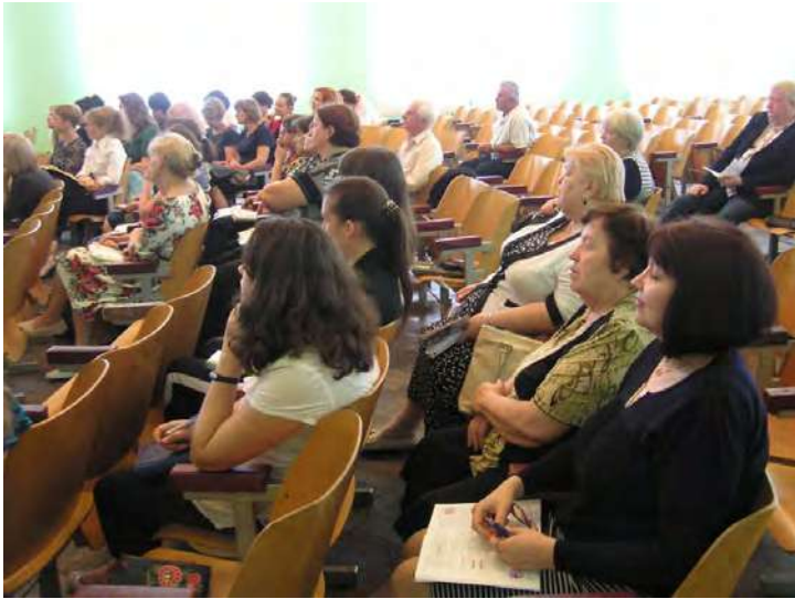
Педагоги Колегіуму №11 уважно слухають доповіді.