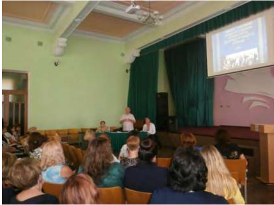
Відкриття науково-практичного круглого столу у Новomosковському колеґіумі №11.