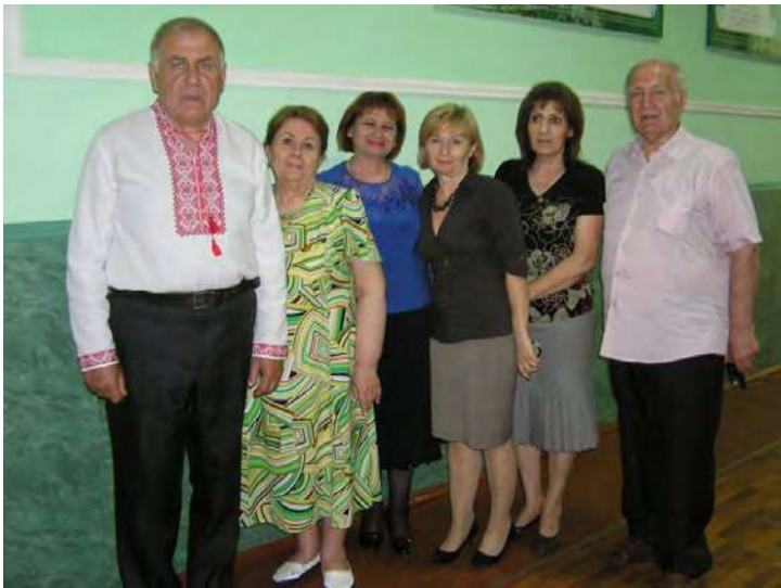
Професори з дирекцією Новомосковського колегіуму №11.