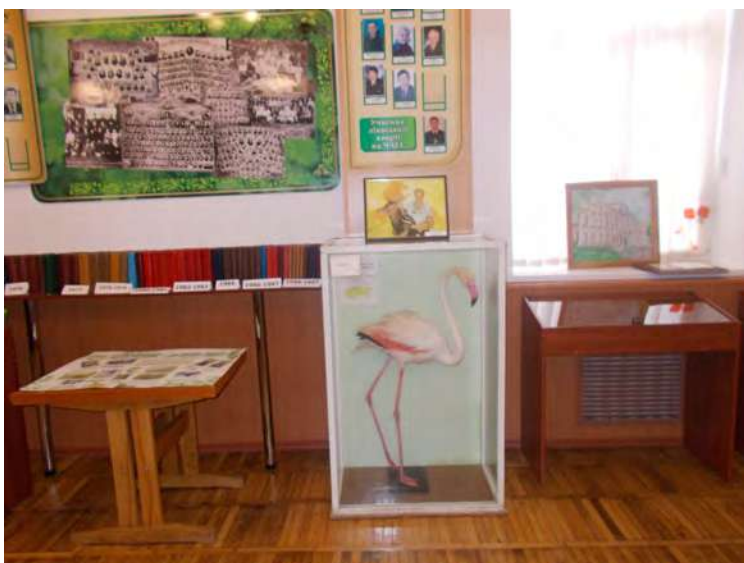
Екологічний відділ музею лісного коледжу.