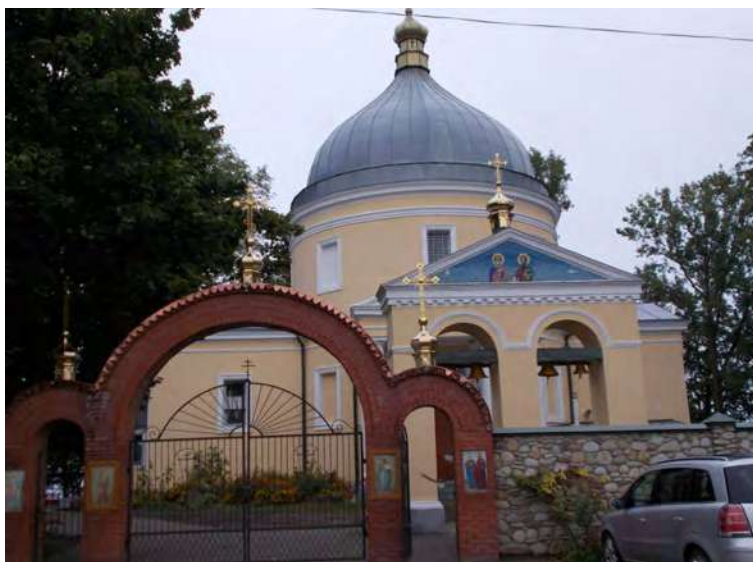
Церква Святих Петра і Павла в селі Світязь – вигляд з різних сторін.