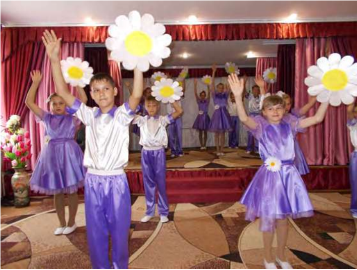
Виступ учнівського танцювального ансамблю Котовського НРЦ.