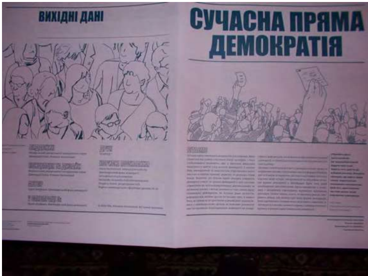
Обкладинка газети «Сучасна пряма демократія», що презентувалася на виставці, організованій Посольством Швейцарії в Україні в конференц-залі Вченої ради Київського національного університету імені Тараса Шевченка 8 жовтня 2018 року.