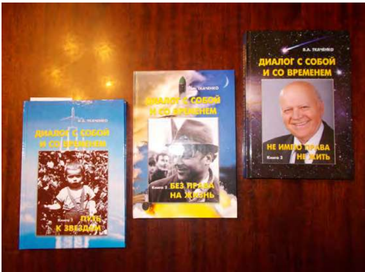
Автобіографічна трилогія академіка В.А.Ткаченка.