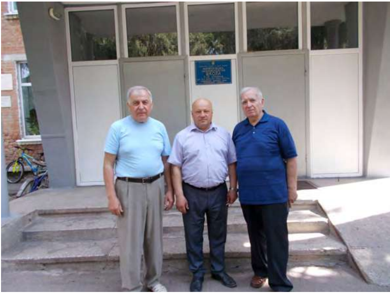
Біля входу до Манжеліївської ЗОШ I – III ступенів.