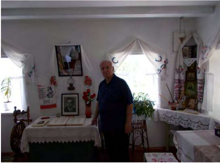
В кімнаті хати, де жив маленький Олесь Гончар.