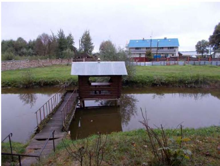
Часовня і купальня біля церкви Петра і Павла в селі Світязь.