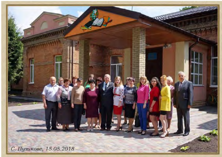
Учасники науково-практичного круглого столу.

Ще одним пунктом, в якому зупинилися науковці, було місто Кобеляки на Полтавщині, в якому жив і яке прославив видатний народний лікар, фундатор української мануальної терапії, Заслужений лікар України Микола Андрійович Касьян, чий пам'ятник в центрі міста та на міському цвинтарі було ними пошановано. Микола Андрійович вів величезну медичну практику, був відомий на весь світ. До нього приїздили на лікування видатні діячі і прості люди, він нікому не відмовляв. Доктор Касьян брав участь у громадському житті Кобеляк, вважав рідне місто духовною столицею світу, як меценат багато зробив для формування сучасного образу рідного міста, побудував храм Святого Миколая, Медичний комплекс, прикрасив вулиці міста тощо.