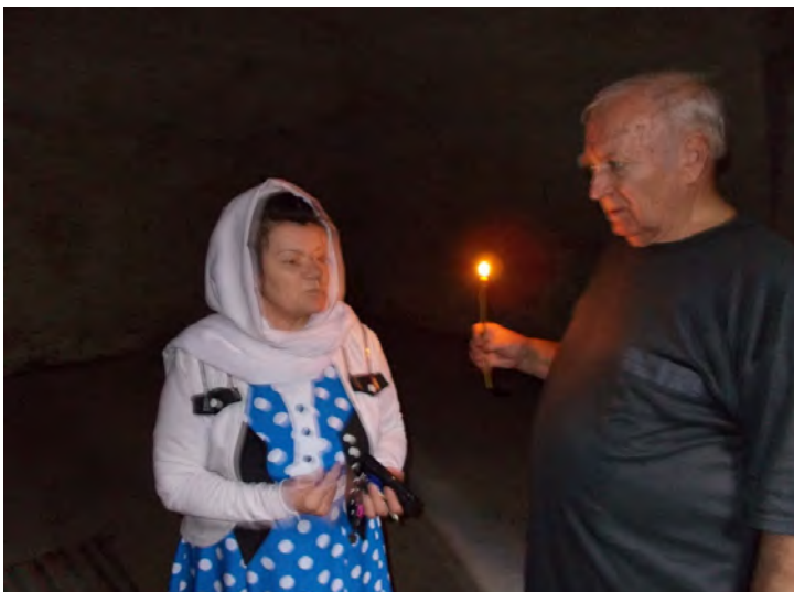
У підземеллі Свято-Миколаївського монастиря.