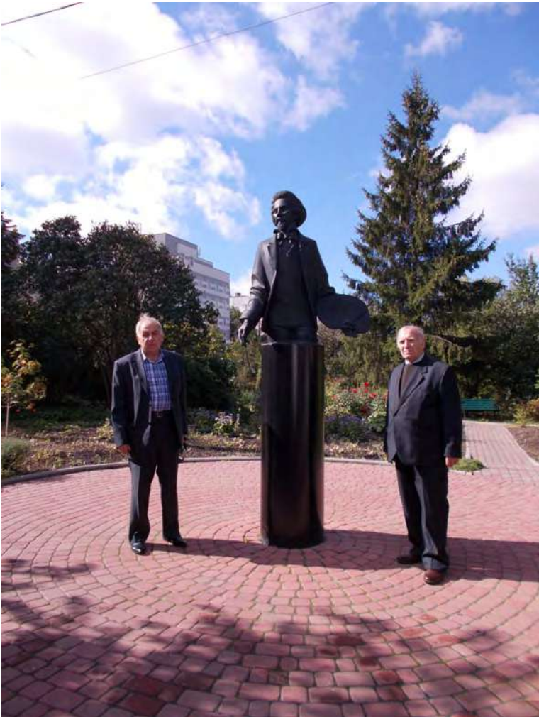
Професори біля скульптурного портрету І.Ю.Рєпіна.