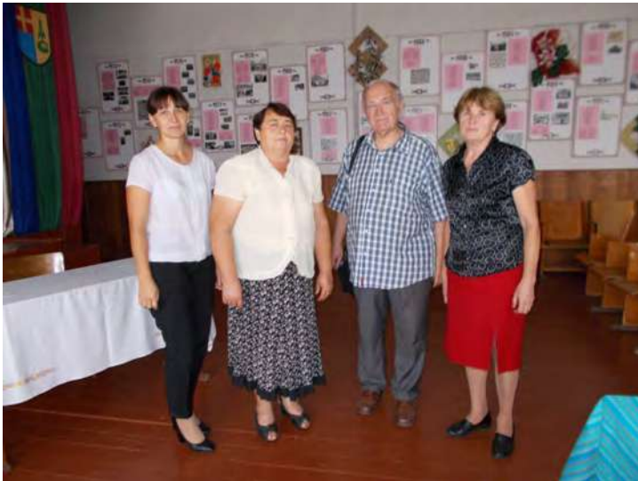
Фото на пам'ять з педагогами школи села Світязь.