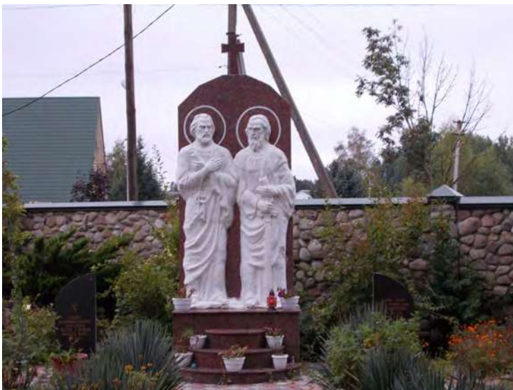
Скульптурна композиція Апостолів Петра і Павла біля церкви.