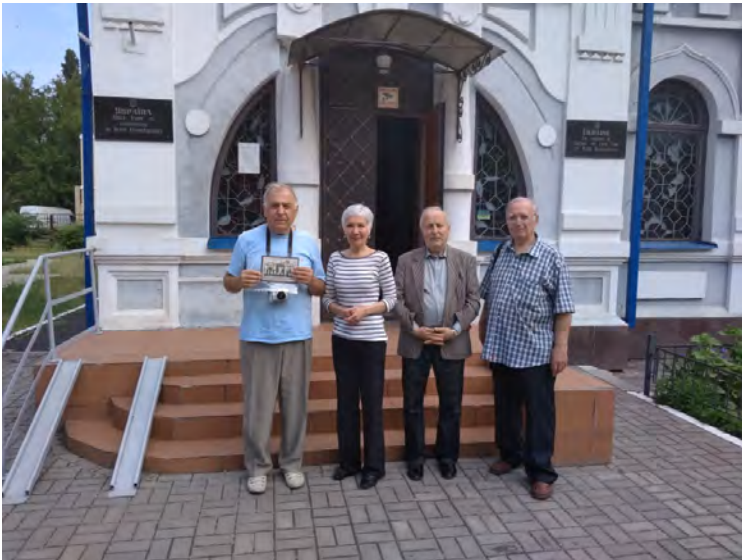
Біля входу до Новомосковського історичного музею.