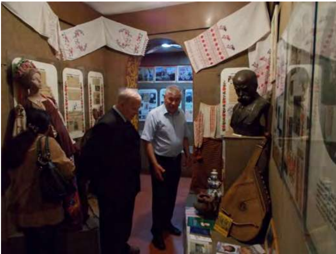
В етнографічному відділі музею.