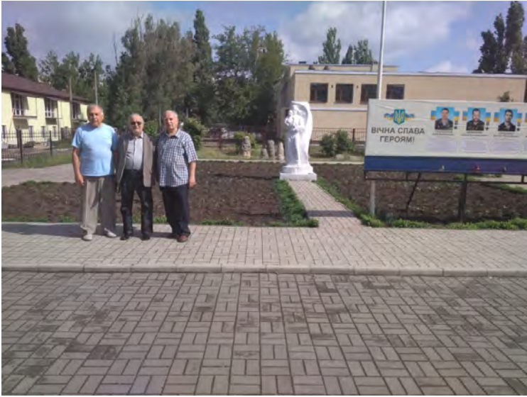
На території Новомосковського історичного музею.