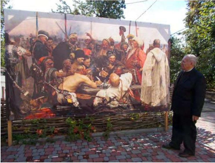
Біля картини І.Ю.Рєпіна просто неба «Запорожці пишуть листа турецькому султану».