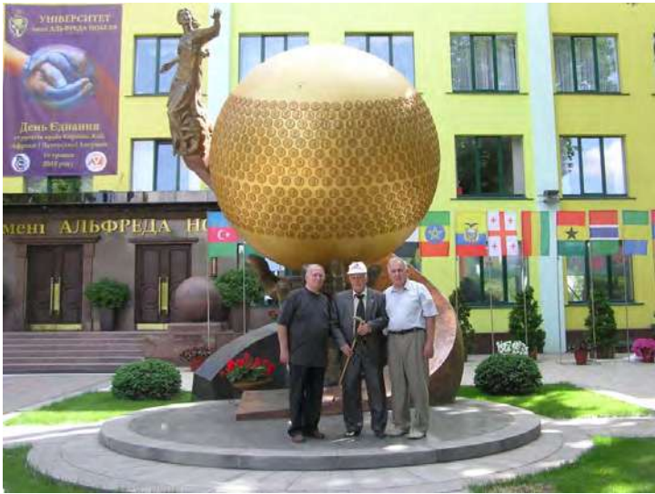
Перед входом до Дніпропетровського університету імені Альфреда Нобеля.