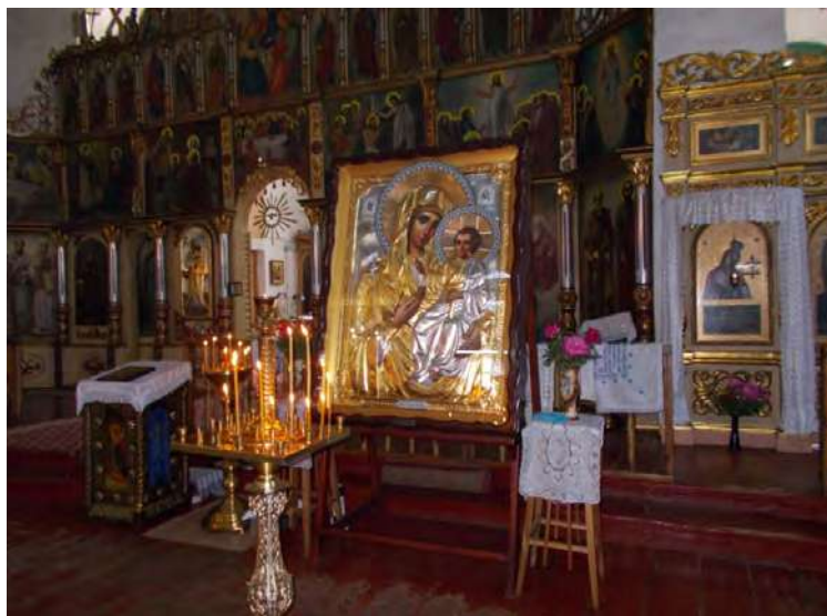
Іконостас Троїцького собору.