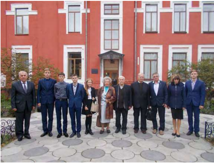
Учасники міжрегіонального семінару.