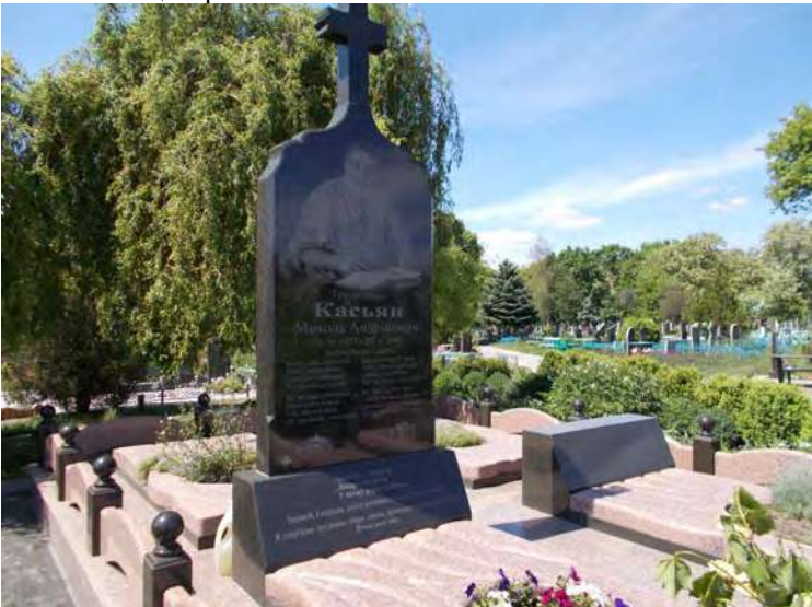
Могила М.А.Касьяна в Кобеляках.