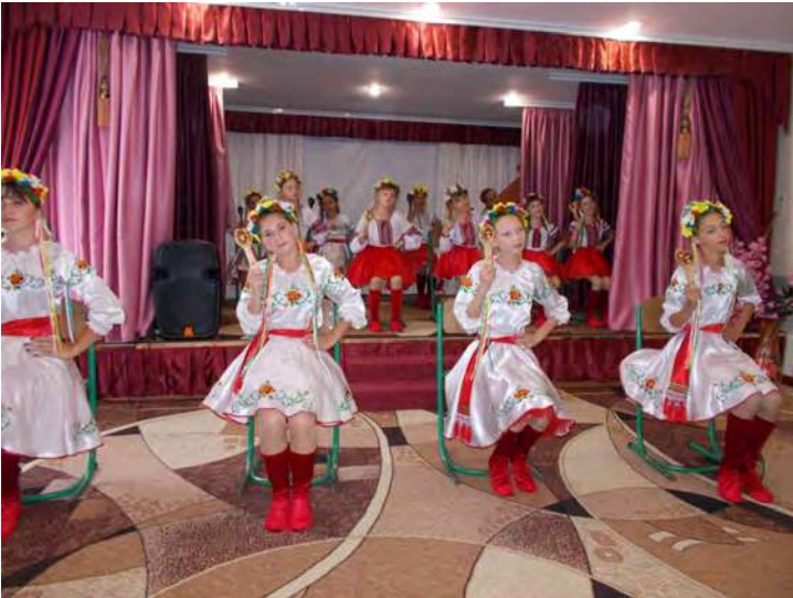
Виступ дитячого ансамблю ложкарів Котовського НРЦ.