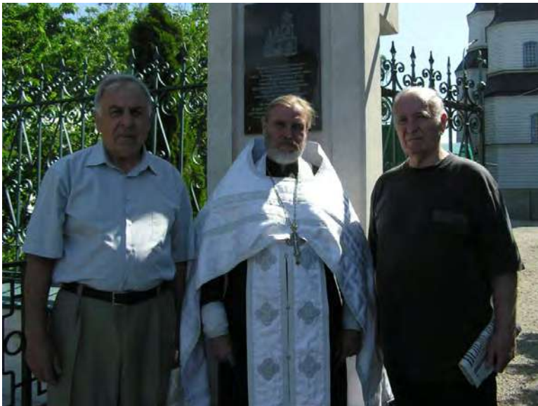
Біля меморіальної дошки, присвяченої Олесю Гончару.