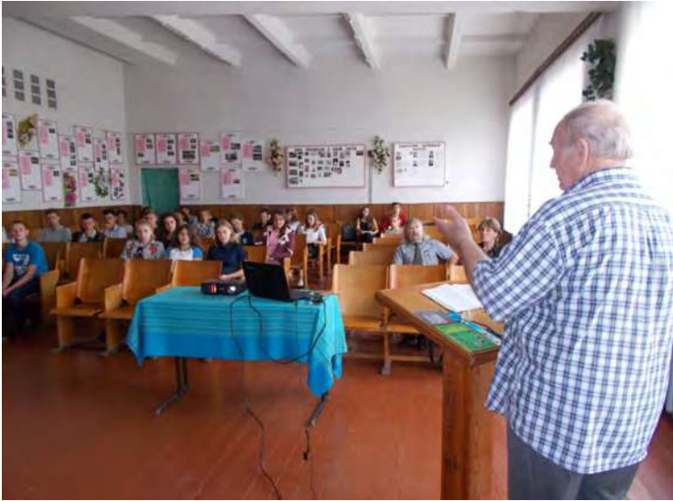
Під час інтерактивної доповіді і тренінгу зі старшокласниками і педагогами школи.