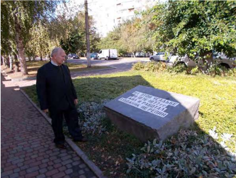
Пам'ятний кам'яний знак біля музею І.Ю.Рєпіна.