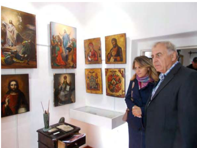
Знайомство з експонатами музею І.Ю.Рєпіна.