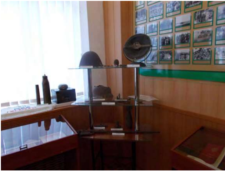
Експонати історичного відділу музею.