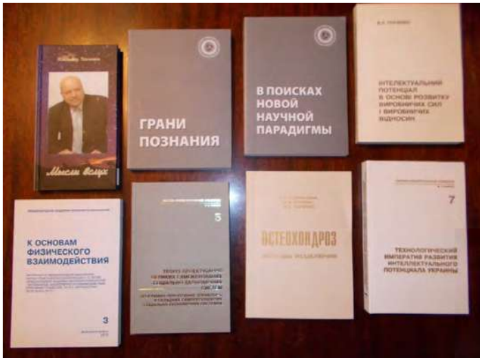
Деякі наукові праці академіка В.А.Ткаченка та представників його наукової школи.