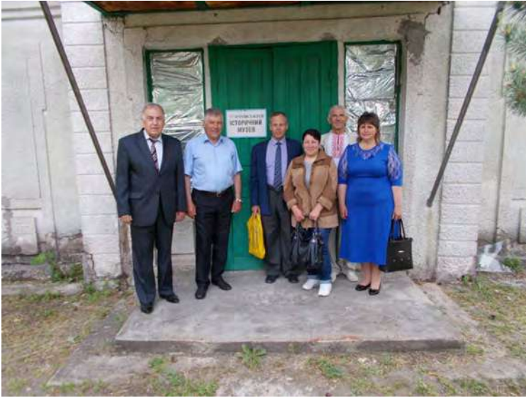
Біля входу в історичний музей села Котовка.