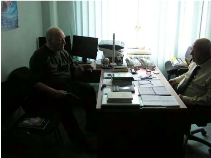
Дискусія с академіком В.А.Ткаченком в його кабінеті.