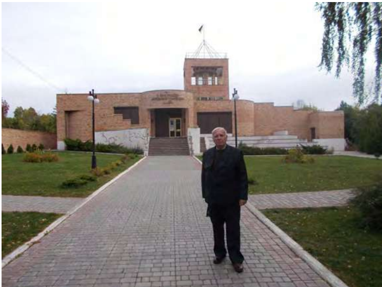
Біля входу в Музей А.С.Макаренка в селі Подвірки під Харковом.

27 вересня 2018 року професори Рибалка В.В. і Самодрин А.П. залишили Кочеток і проїжджаючи через увесь Харків дісталися села Подвірки, де розташований музей А.С.Макаренка. На цьому місці в кінці 1920-х – на початку 1930-х років в Куряжі знаходилася відома на весь світ педагогічна комуна А.С.Макаренка, яка описана в його «Педагогічній поемі». Ознайомлення з експонатами музею переконливо свідчить про демократичний характер соціально-педагогічної системи геніального педагога. Адже вже на фронті музею викарбовані його слова: «Я був просто народним вчителем». Його комуна без перебільшення нагадує французьку комуна як територіально-політичну одиницю державного устрою Франції і сучасне громадянське суспільство в Швейцарії і США. Про це нам ствердно говорила і екскурсовод музею – пані Людмила.