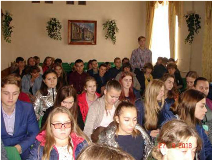
Ліцеїсти беруть активну участь у тренінгу, виступають із пропозиціями.