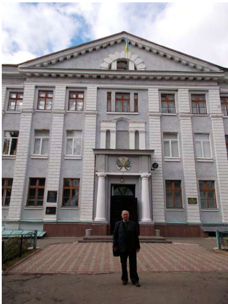
Біля головного входу у Чугусво-Бабчанський лісний коледж.