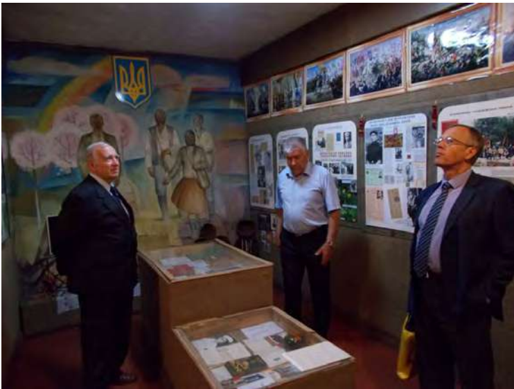
Ознайомлення з експозицією історичного музею.