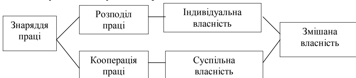
Рис.3.1. Схема природи трансформації власності

Основні вузли, що визначають природу трансформації власності можна уявити наступною спрощеною схемою.