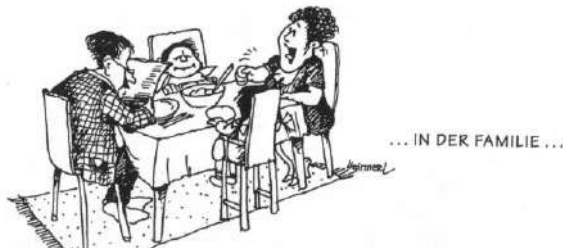
In der Familie

Sprechen und Zuhören bestimmen unser Leben: