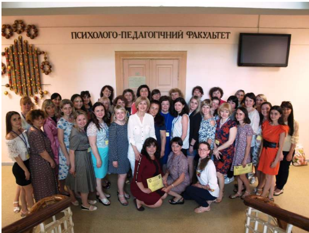
Учасники Всеукраїнської науково-практичної конференції (з міжнародною участю) «Дошкільна освіта в Україні в умовах світових змін» у м. Полтаві (травень 2019 р.)