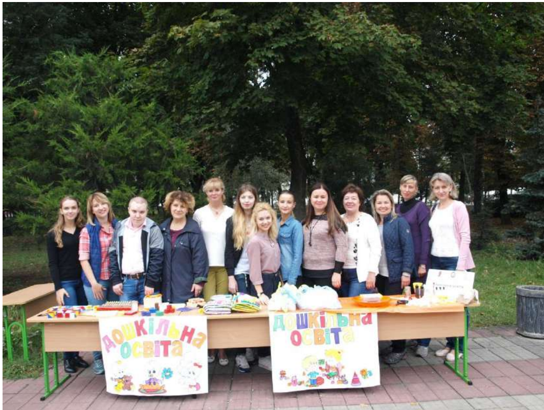
Участь кафедри дошкільної освіти у Міжнародному проекті «Місто Професій» (вересень 2018 р.)

Для виховної роботи кафедри дошкільної освіти характерні систематичність, послідовність і різноманітність форм та методів взаємодії зі студентською молоддю. Викладачі регулярно звітують про виконання запланованого на засіданнях кафедри.