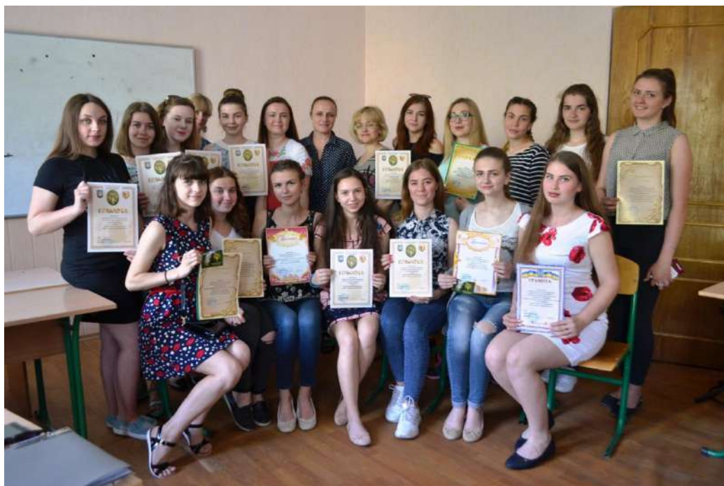
Переможці конкурсу студентських творчих проектів на тему «Шануємо Україну, пишаємося рідним краєм» (травень 2018 р.)