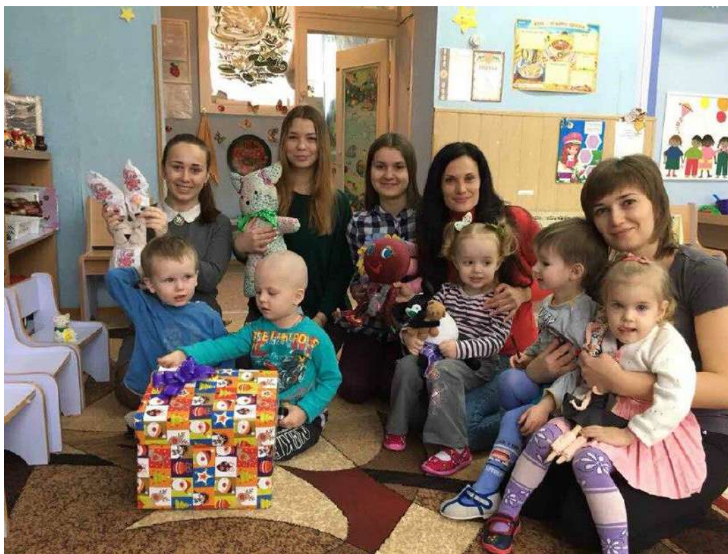
Студентська акція до Дня Святого Миколая «Подаруй радість дітям» (грудень 2017 р.)