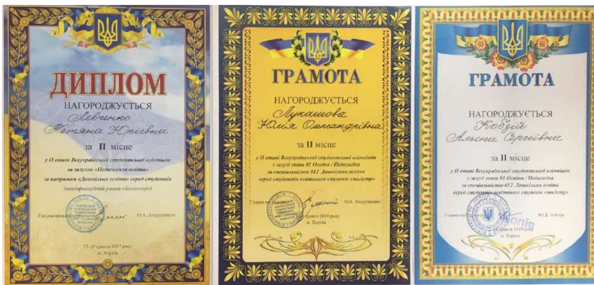
Наукові здобутки студентів спеціальності 012 Дошкільна освіта ПНПУ імені В.Г. Короленка у Всеукраїнській студентській олімпіаді