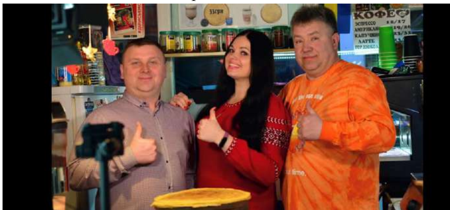
«Секрети приготування млинців із Дніпра»

Із самого початку працювати над проєктом було не складно, адже герої наших передач — це наші друзі, односельці, знайомі. Кожен із них — унікальна і непересічна особистість. На сьогодні уже відзнято шість таких фільмів, чотири опубліковано на каналі YouTube . Серед них: