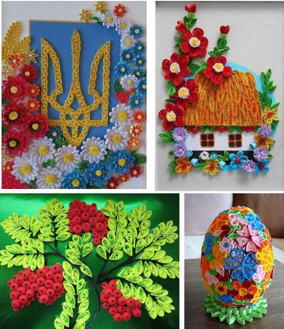
Рис. 2. Квілінг. Роботи на тему: «Мальовнича Україна»

Робота над ескізами та макетами розвиває уяву, відчуття композиції, здатність мислити образами. Студент повинен дотримуватись у роботі принципу «від загального до часткового» з подальшим розробленням «від часткового до гармонійного цілісного», творчо перетворювати природні форми в стилізовані декоративні образи, зберігаючи найхарактерніші ознаки реальних об'єктів. Хоча їх складові відтворюються умовно, вони мають бути художньо виразними. Уміння втілити функціональні й конструктивні завдання в гармонійній формі виробу є ознакою справжньої майстерності майбутнього педагога.