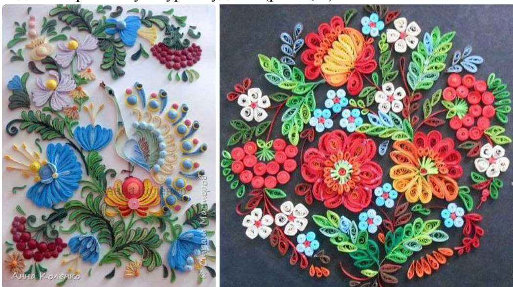
Рис. 1. Квілінг. Роботи на тему: «Петриківський розпис»

В Україні в останні роки спостерігається значне зростання інтересу до даного виду мистецтва. Вивчення художніх особливостей паперової пластики як складової проєктно-художньої творчості є одним із основних засобів формування дизайнерської культури студента (рис. 1, 2).