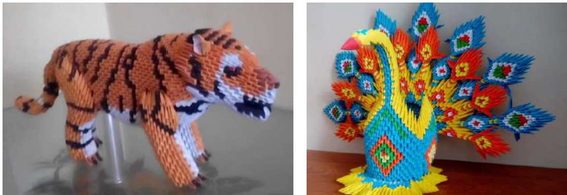
Рис. 1. Модульне оригамі

Втілення задуму в паперовій пластиці потребує певної стилізації. Тут потрібні наполегливість митця, цілісне уявлення загальної форми, вміння визначати в об'єкті головне і другорядне. Ступінь стилізації зумовлюється, з одного боку, простотою форми, лаконізмом, цілісністю, з іншого — передачею знайдених у процесі трансформації ідей засобів композиції: симетрії, пропорційного членування форми, ритмічної організації, розстановки акцентів (рис. 1).