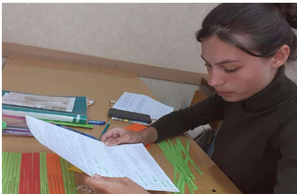
Фото 2. Студентка третього курсу складає презентує план-конспект за «Лінгводидактичним конспектом»