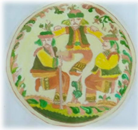
Рис. 3. Зарисовки косівської кераміки. Серебряков М.

Становлення особистості з її національною свідомістю є основоположним викликом сучасного українського педагога, адже людина народжується і живе в конкретному національному середовищі, і саме це середовище є невичерпним джерелом для її творчості і культурно-естетичного розвитку. Історична дистанція в часі дає можливість виявити, осягнути, реконструювати та інтерпретувати мистецькі цінності минулого. Декоративно-прикладне мистецтво України – це відтворення глибинної історії нації, її неповторного міфологічно-символічного сприйняття дійсності [1, с. 81]. Завданням педагога є допомогти студенту, а отже і майбутньому представнику української культури, осягнути спадок своїх предків. І, можливо, саме цей мистецький здобуток минулих поколінь вплине на розвиток творчості та вектор художньої діяльності того чи іншого студента-майбутнього митця.