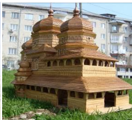
Рис. 8. Церква Святого Юра у Дрогобичі (зліва) та її макет (справа)