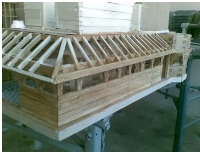
Рис. 5. Виготовлення галерейних арок