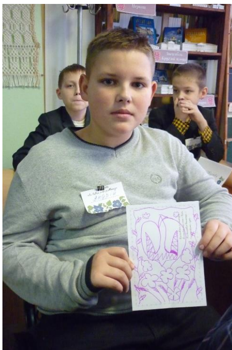
рис. 1 «Я малюю вишивку»