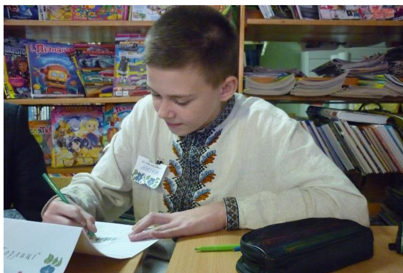
рис. 4 Учень у вишиванці