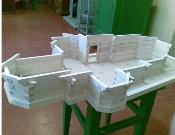
Рис. 3. Виготовлення основи та несучих стін церкви

використанням комп'ютерної програми (SolidWorks) та SLS-технології; 3) виготовлення макету-копії цієї церкви у масштабі 1 : 25 (див. рис. 3 – 8).