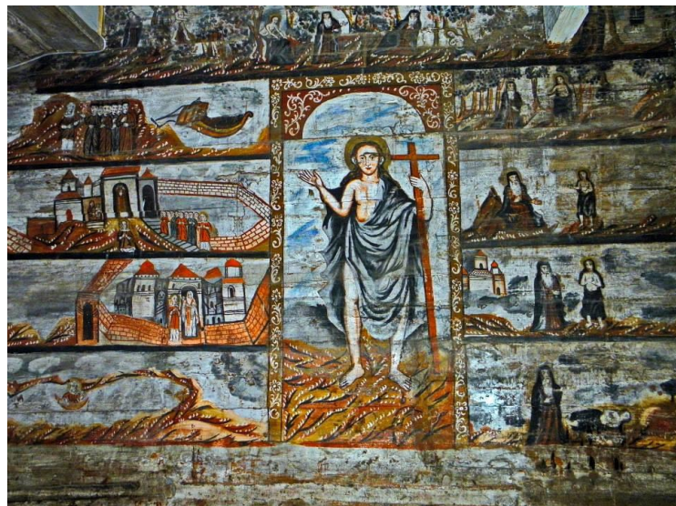
Рис. 2. Настінний розпис церкви Святого Юра в м. Дрогобич

Зазначений культовий об'єкт є найкраще збереженою дерев'яною спорудою традиційного типу зрубів, завдяки яким можна дослідити як історію архітектурного проектування в Карпатському регіоні, так і вітчизняні традиції сакральної архітектури, будівництва, іконопису, орнаментики тощо. Тому викладачами та студентами Дрогобицького педагогічного університету було реалізовано дослідницький проєкт, який складався з низки етапів: 1) пошук інформації, оцифрування (фотографування фрагментів внутрішнього інтер'єру й екстер'єру церкви – фасаду, галерей, вікон, дверей, сходів, арок, конструктивних особливостей столярних з'єднань тощо) та паспортизація зібраних матеріалів про дрогобицький храм; 2) графічне виконання прототипу макету церкви та креслень з