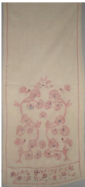
рис. 1. Весільний рушник

Цей орнамент відображає будову Всесвіту в уявленні наших пращурів (підземний світ — коріння, світ людей — стовбур з гілками, горішній світ (світ богів) — верхня сонце-квітка [4, с.60], минуле, теперішнє, майбутнє і народу, і кожної родини зокрема. Тісно пов'язаний цей рослинний мотив з давнім культом богині-рожаниці, яку зображували як жінку-породіллю, що є символом плодючості, родючості, добробуту [3, с. 21].