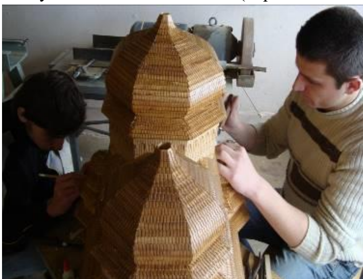
Рис. 7. Виготовлення куполів («бань») і покриття «гонтами»