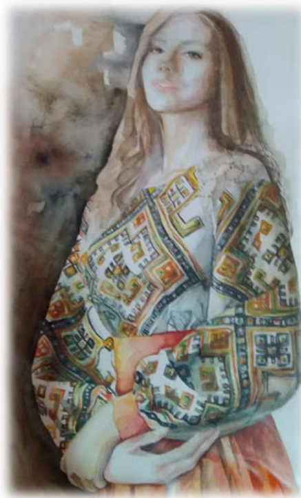
Рис.1. Інтерпретація народного строю в сучасний український одяг.

У виховному процесі навчального закладу виконання лабораторно-практичних робіт з предмета Історії декоративно-прикладного мистецтва і, зокрема, народної творчості, несе у собі не лише практичні навички та наочне вивчення того чи іншого виду мистецтва, але і формування патріотичного духу. (рис.1.).