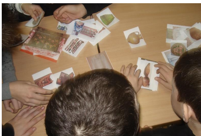
рис. 2 («Цікавинки з торбинки»)

Третя частина – творче завдання «Подорож у часі». Дівчата-учасниці одягають святковий народний стрій з усіма традиційними елементами (рис. 3). Виконання дій спрямоване на особистісно-емоційне сприйняття, використовуються методи: занурення в історичну епоху, локалізація, рольове «прожиття» культурних подій. Естетичні фактори значно впливають на розвиток патріотичних почуттів, формують базову психологічну прихильність людини до своєї нації, залучають до її