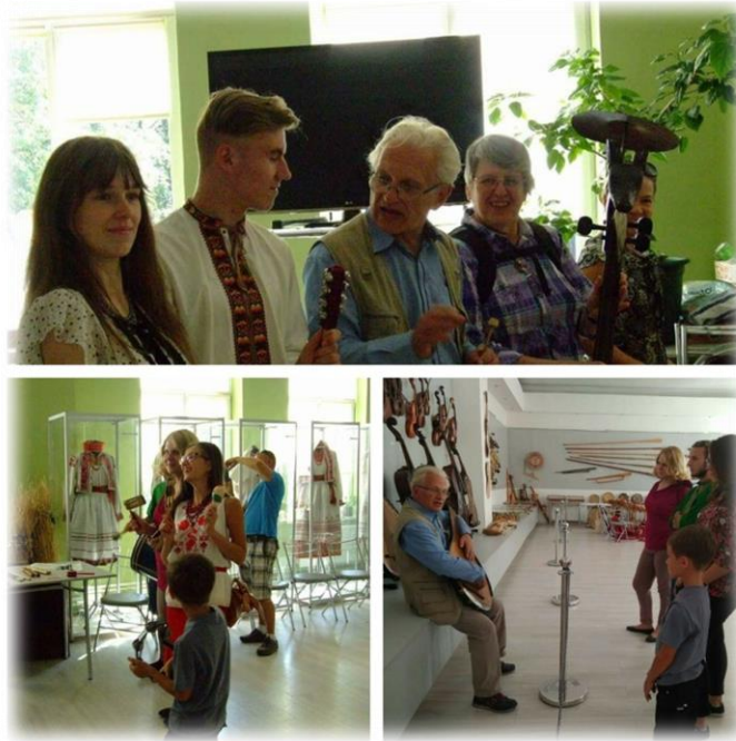
Рис. 2. Відвідування Музею народної архітектури та побуту у Львові імені Климента Шептицького

Саме музейний простір дає можливість учням художніх спеціальностей вповні побачити все різноманіття ремесел українців, доторкнутись в інтерактивній формі до народних інструментів, детальніше оглянути народний стрій, кераміку, ковальство, ткацтво та інші види декоративно-прикладного мистецтва. На території Музею народної архітектури та побуту у Львові імені Климента Шептицького є велика кількість української традиційного дерев'яної архітектури: і хати, і господарські приміщення, і церкви, і дзвіниці, і школи. Усі ці об'єкти мають облаштований інтер'єр, що дає змогу краще зрозуміти побут українців, який був розповсюджений в сільській місцевості ще на поч.. ХХ ст.. Музейна педагогіка формує перспективний та ефективний освітньомузейний модуль інтелектуальних перетворень особистості, які дають позитивні зміни при впровадженні її в освітній процес, а результатом цього процесу постає виконання зарисовок того чи іншого виду декоративно-прикладного мистецтва: чи писанкарства, чи вишивки, чи ткацтва, чи кераміки, чи ін. (рис.3)