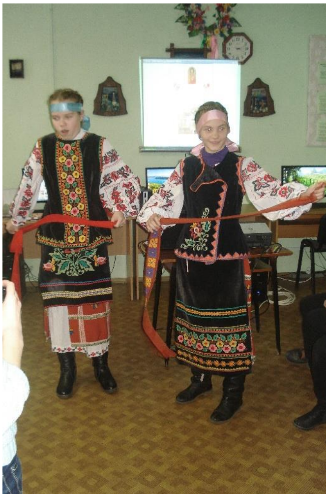
рис.3 Учениці одягнені в український народний стрій

духовних скарбів, – відбувається усвідомлення власних світоглядних орієнтацій. Діти часто відвідують заходи у вишиванках (рис. 4).