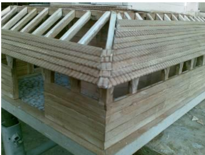
Рис. 6. Покриття даху і піддашся «гонтами» (дерев'яними дощечками)