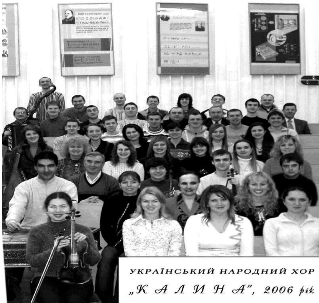
УКРАЇНСЬКИЙ НАРОДНИЙ ХОР „КАЛИНА”, 2006 рік