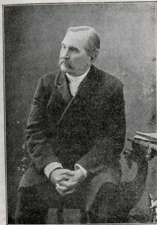
М. В. Лисенко в 1904 році.

загуділо і загомніло, і знову Лисенко, наче цих 50 років і не пронеслося над його вже сивою головою, так само жвавий, так само