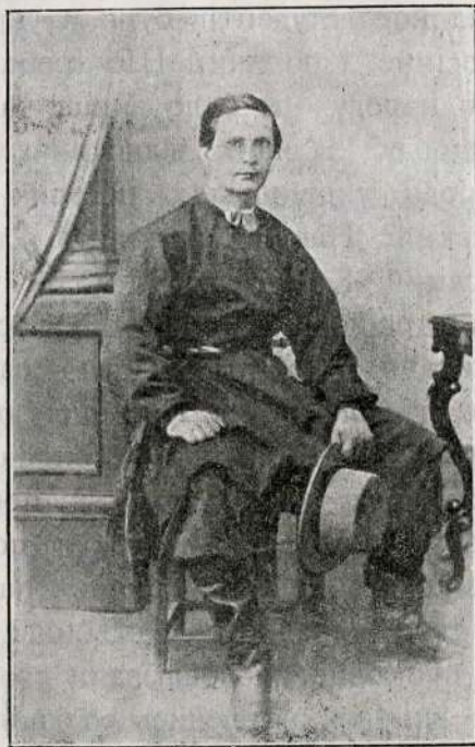
М. В. Лисенко в 1864 році.

му, в рідне село, Лисенко ближче знайомиться з народом, ходить з фісгармонією на досвітки та вечорниці, з захопленням слухає пісні та заводить їх у ноти. Потім, уже