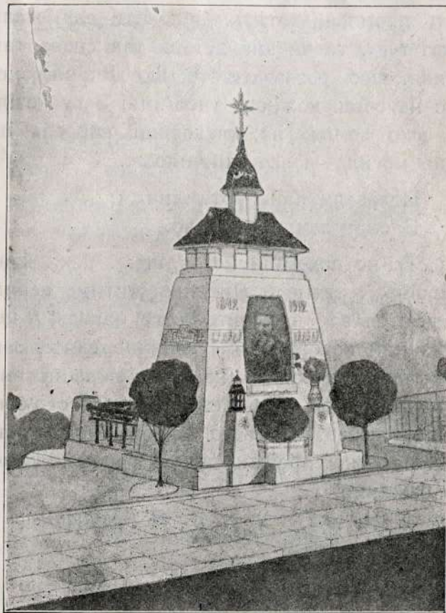
Проект надгробка, який має бути поставлений на могилі М. В. Лисенка.

Похід тихо йшов далі. З вікон „Народнього Дому“, де грала трупа Садовського,