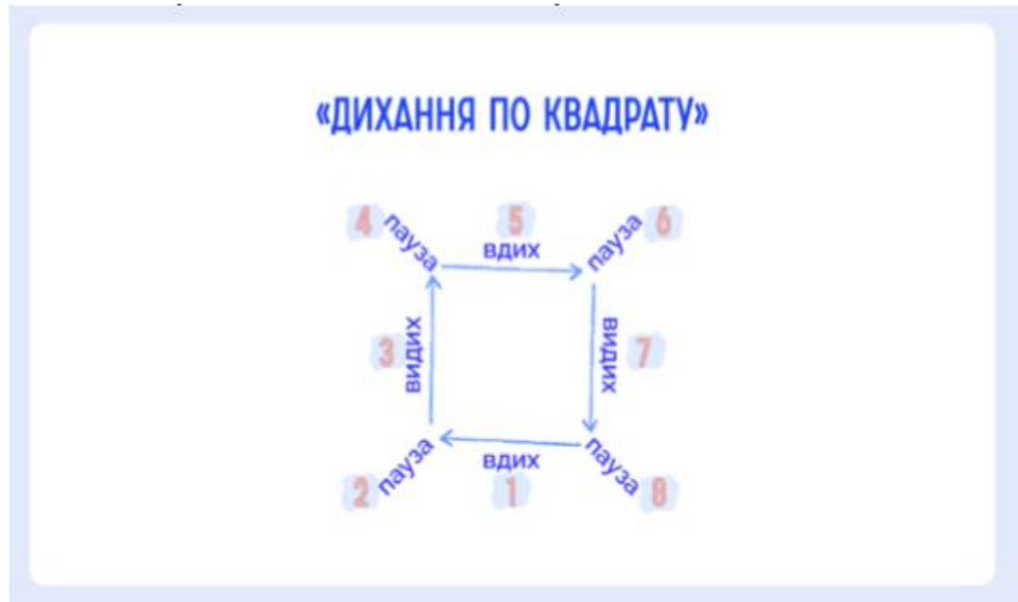
Рис.1. Дихання по квадрату

Таким чином людина починає контролювати своє дихання. Також це і тактильні відчуття – людина починає відчувати своє тіло.